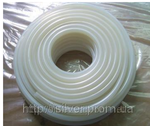
Шланг силиконовый термостойкий