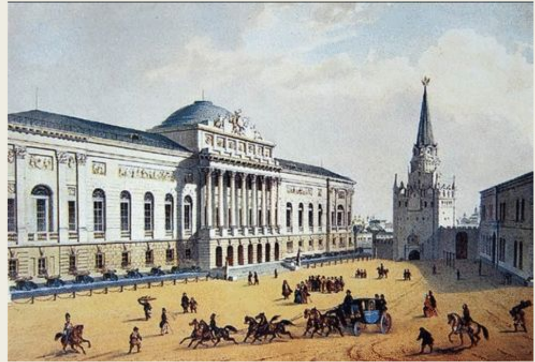
Акварель Ивана Вейса «Старое здание Оружейной палаты», 1852 год

С начала XVII века Оружейная палата руководила приказами, впоследствии вошедшими в её состав. В 1700 году кремлёвские мастерские стали сокращаться, а с началом Русско-шведской войны деятельность Оружейной палаты была переформирована на военный лад.