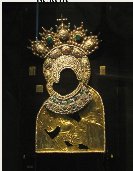
Оклад Владимирской иконы Божьей матери XVII века