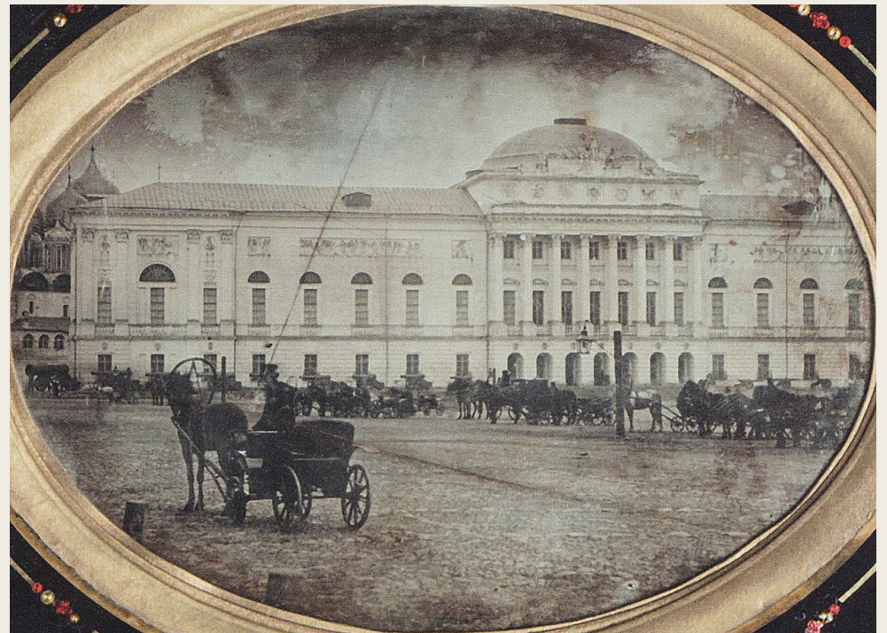
Старое здание Оружейной палаты до перестройки. Единственный дагеротип 1845-1852 года

К 1820 году выявился ряд недостатков здания. Отсутствие системы обогрева создавало условия, враждебные для сохранности экспонатов.