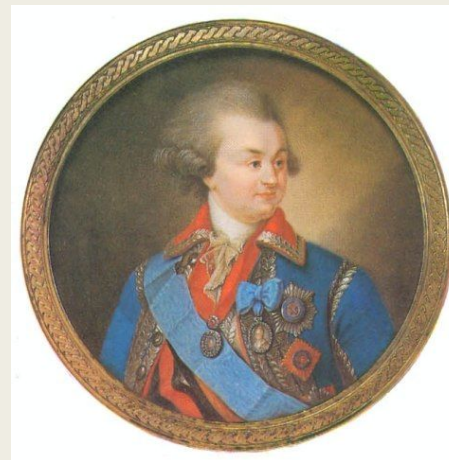
Портрет фельдмаршала Григория Потёмкина, 1790-е годы