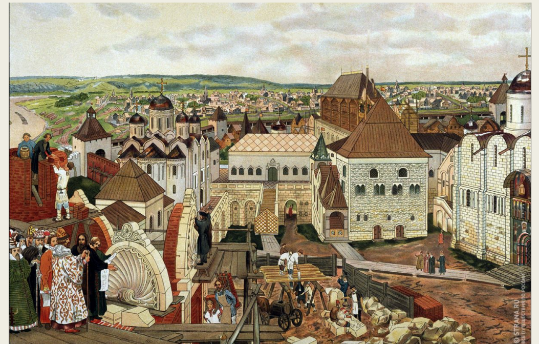
Аполлинарий Васнецов. Акварель «В Московском Кремле»