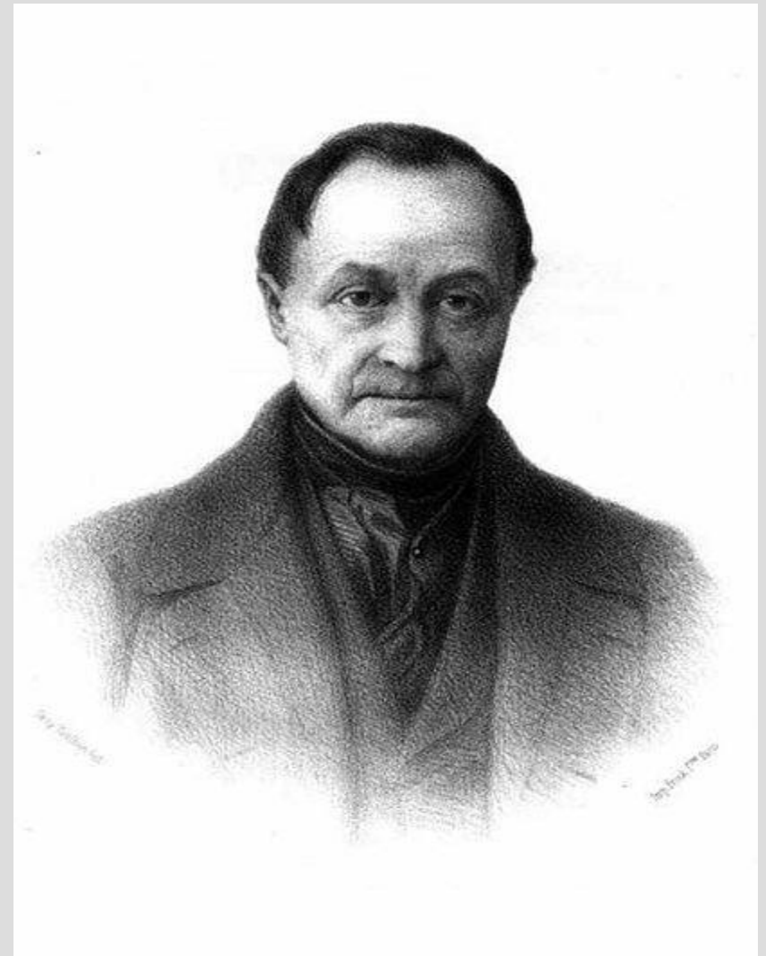
Огюст Конт (1798 - 1857)

Термин «социология» был введён в научный оборот Огюстом Контом в 1832 году. Конт считал, что социология - это наука, занимающаяся, как и другие науки (формы « позитивного знания »), наблюдением, опытом и сравнением, которые адекватны новому социальному порядку индустриального общества.