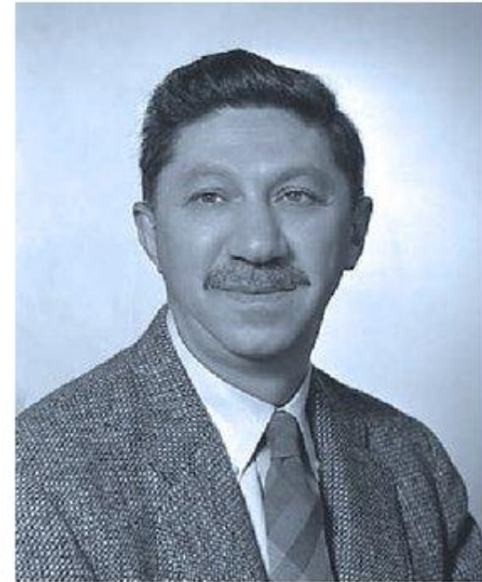
Абрахам Маслоу (1908-1970)

Удовлетворение потребностей, расположенных внизу иерархии, делает возможным осознание потребностей, расположенных выше в иерархии, и их участие в мотивации.