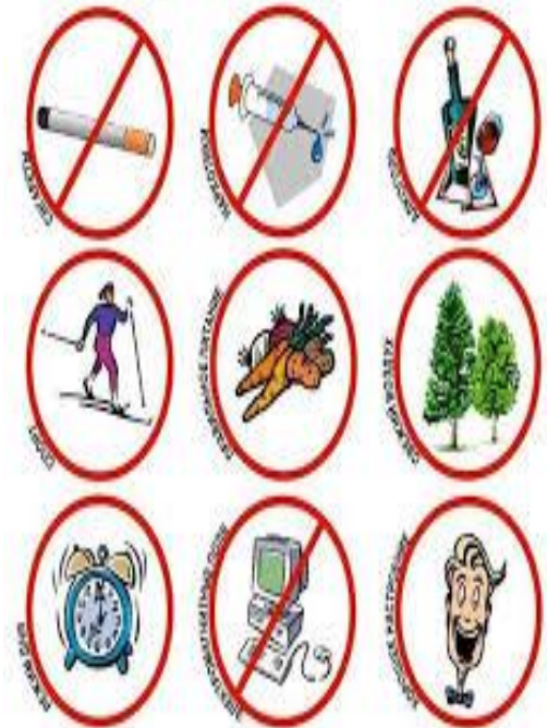
Правила здорового образа жизни

Темекі шегуден , ішімдіктен, есірткі және уытты заттардан бас тарту. Бұл зиянды әдеттер организмге әсер етіп, денсаулыққа зиян келтіреді.