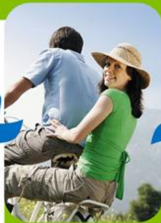
Активный образ жизни