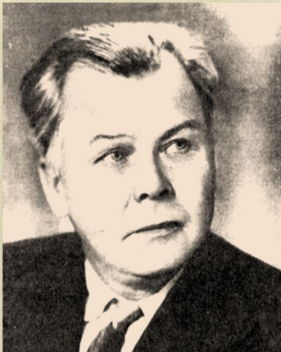
Александр Трифонович Твардовский (1910–1971 гг.)