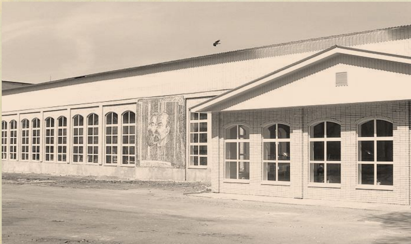
Смоленский педагогический институт