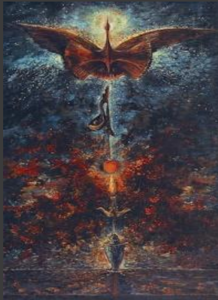
«Моя вертикаль» 1994.