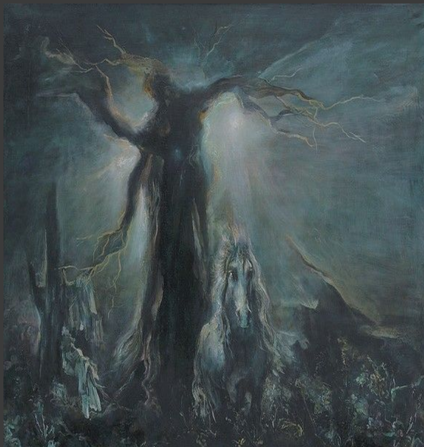
«Белая лошадь» 1996.