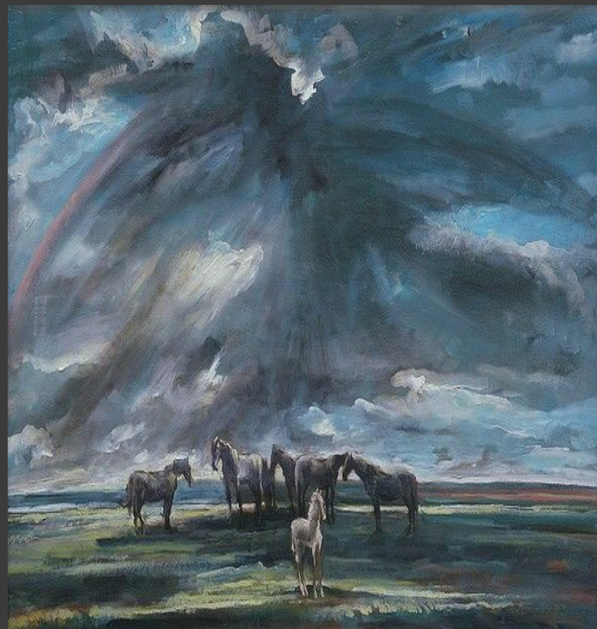
«После грозы» 1993.