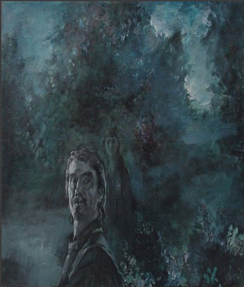
«Сирень цвет» 2002.