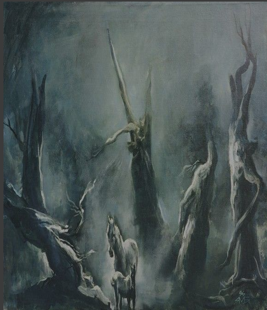
«Лунный свет» 1996.