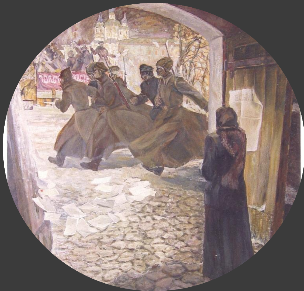
«В дни Октября».