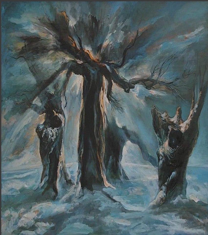
«Корни Ямбердэ» 1992.