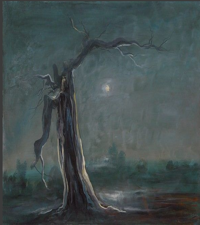
«Крик в ночи» 1990.