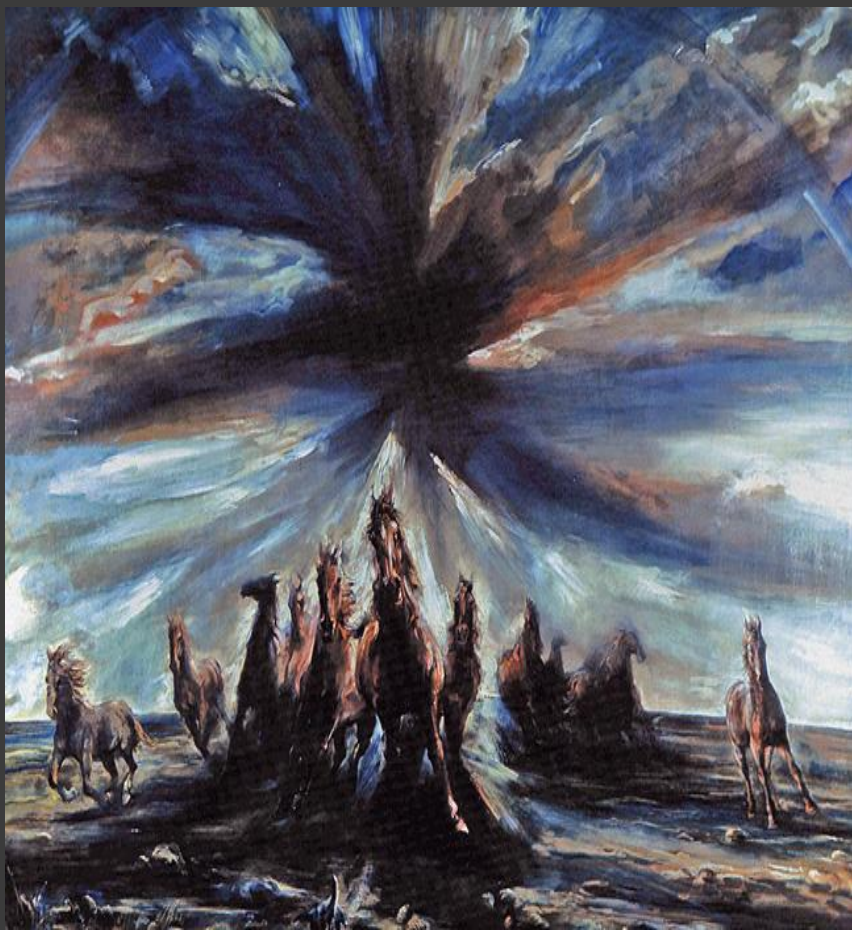
«Радужный табун». 1992.