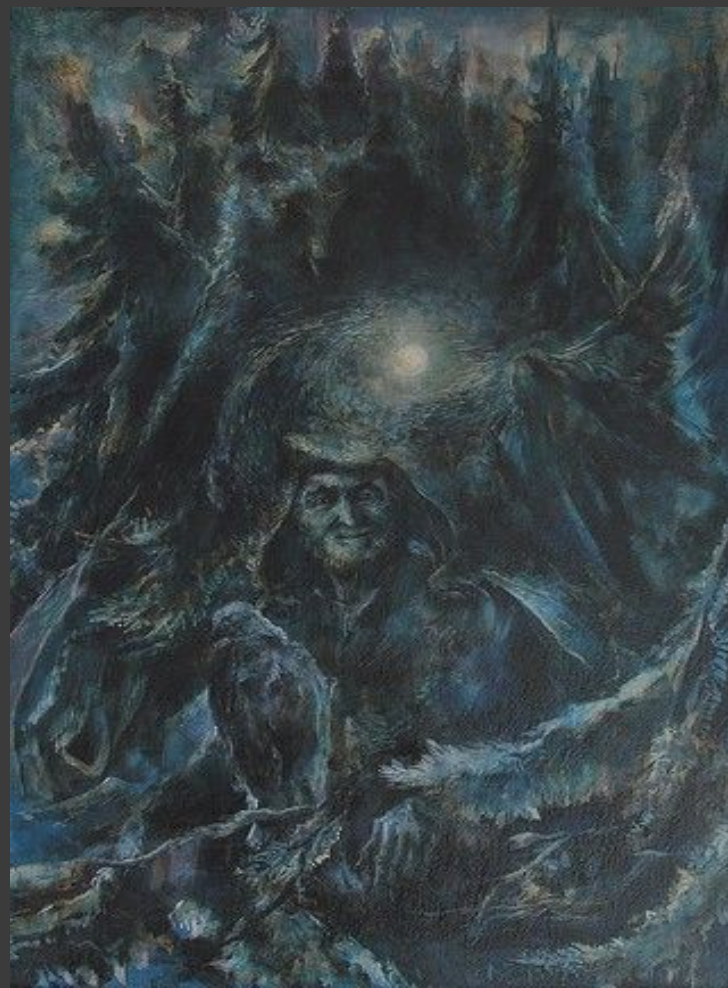
«Марий чодыра». 1997.