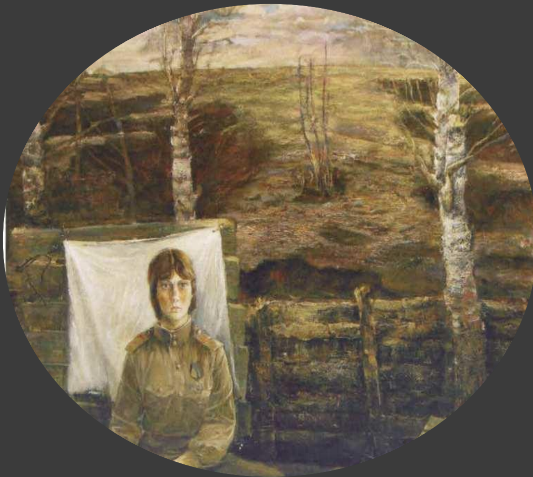
«Фотография на партбилет». 1984 год.