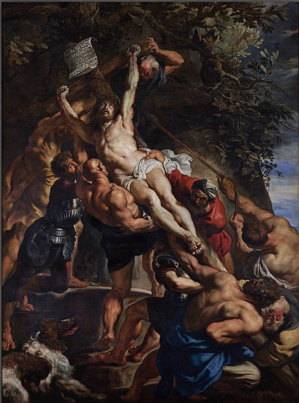
Водружение креста. Собор, г. Антверпен. 1610 - 1611