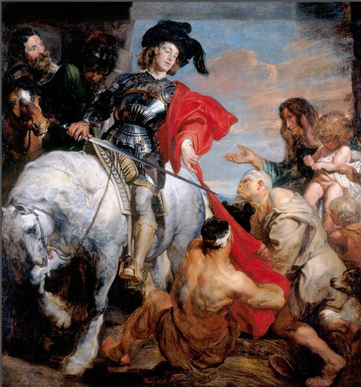
Святой Мартин и нищие. Королевское художественное собрание в Виндзорском замке, г. Виндзор. 1620 г.