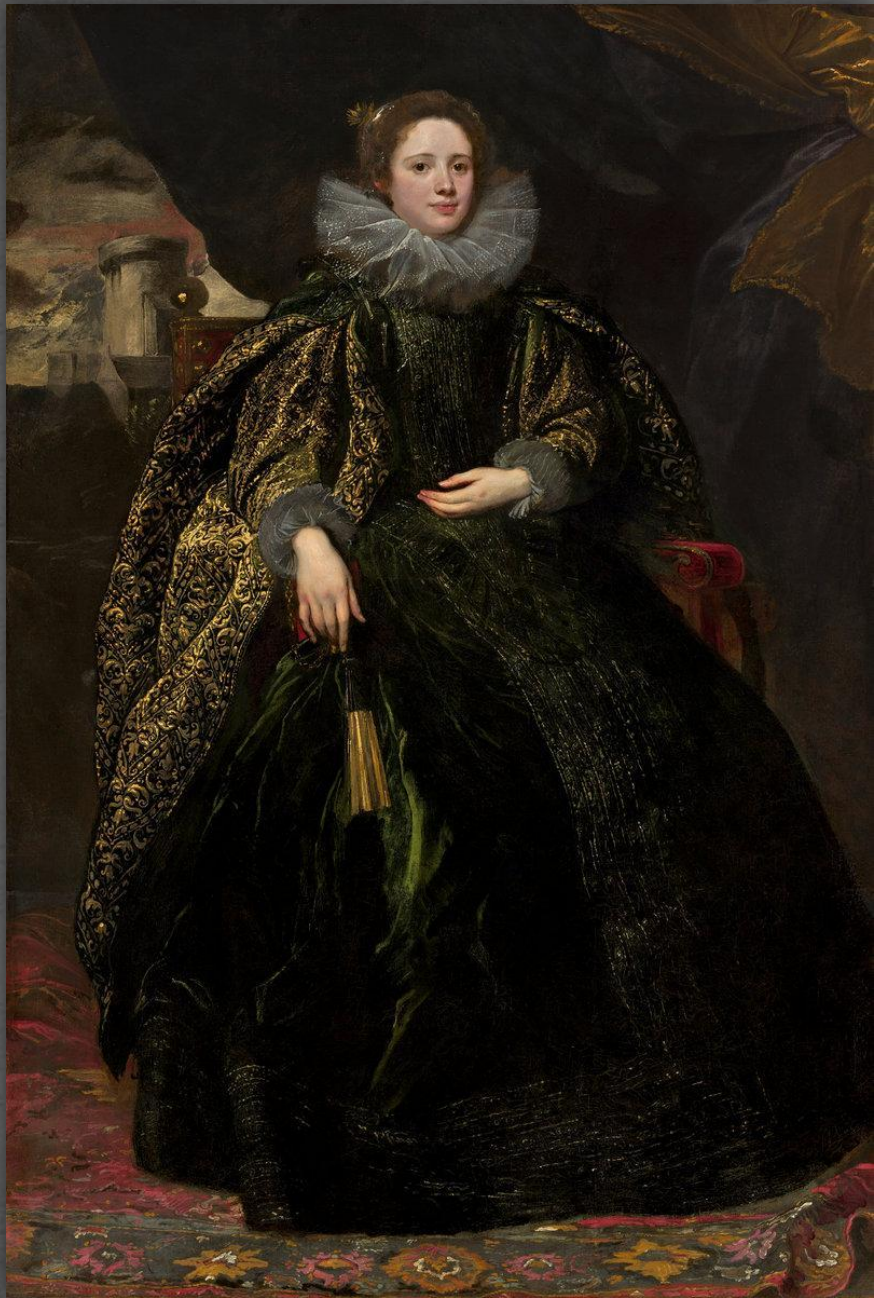
Портрет маркизы Бальби. Музей Метрополитен, г. Нью-Йорк. 1622 – 1627 гг.