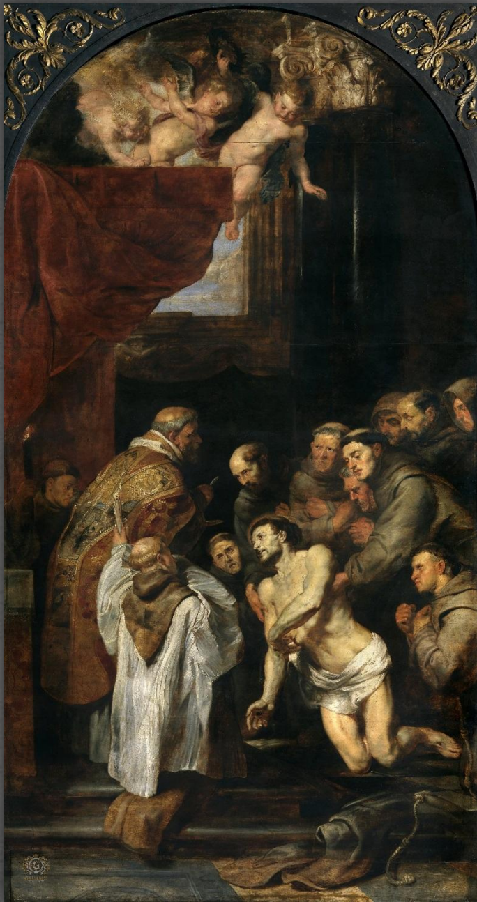
Последнее причащение Святого Франциска. Королевский музей искусств, г. Антверпен. 1619