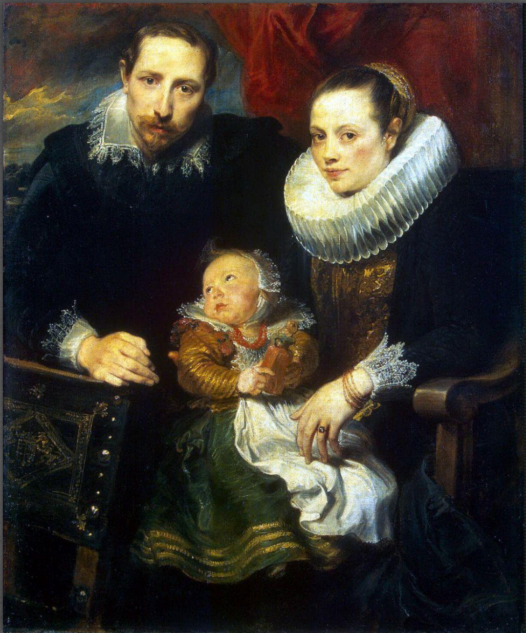
Семейный портрет. Эрмитаж, СПб. 1621 г.