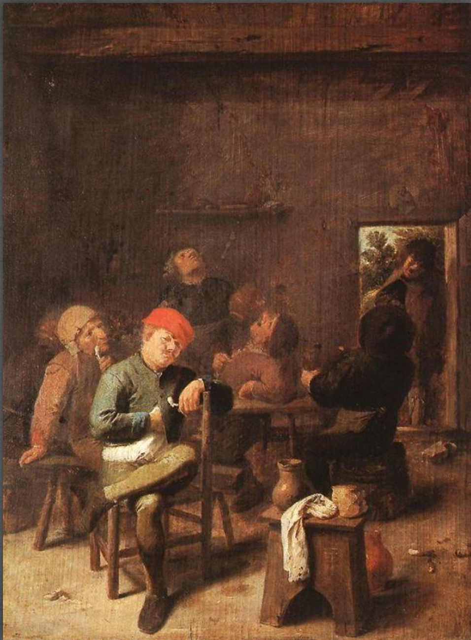
Пьющие за столом. Старая Пинакотека, г. Мюнхен. Ок. 1633 – 1636 гг.