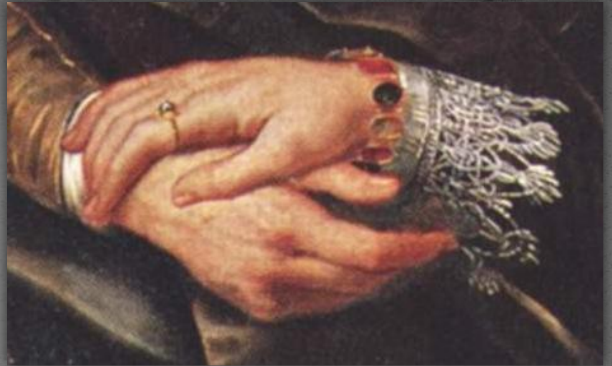
Жимолостная беседка или автопортрет с с Изабеллой Брант. Старая Пинакотекка, г. Мюнхен. 1609 г.