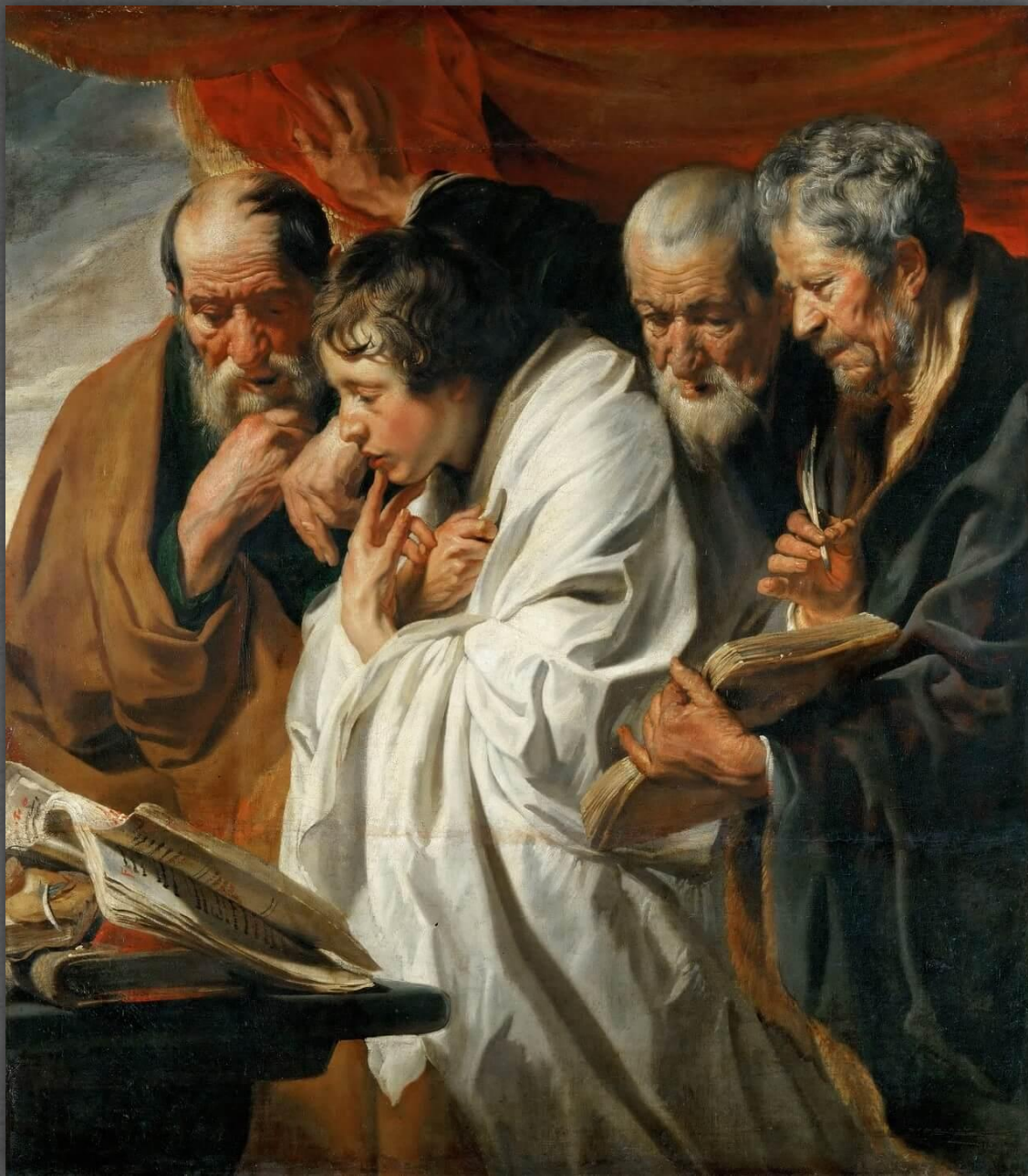
Четыре Евангелиста. Лувр, г. Париж. 1625 г.