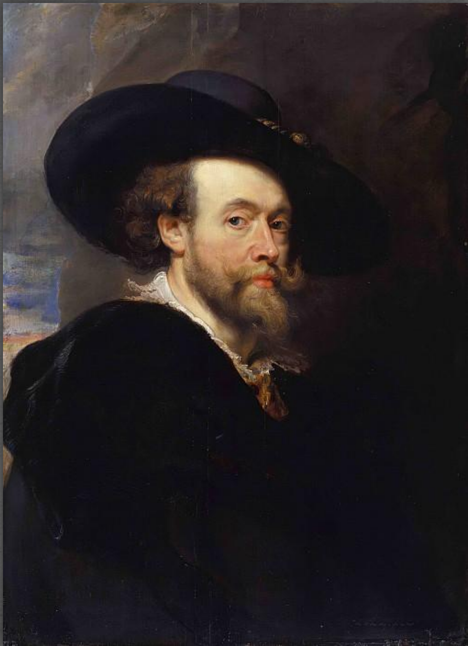
Автопортрет . Национальная галерея, г. Канберра. 1622 – 1623 гг.