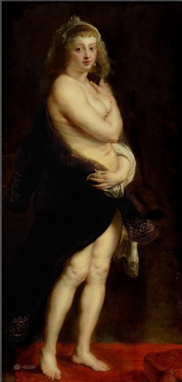
Портрет Елены Фоурмент (Шубка). Художественно-исторический музей, г. Вена. 1638 – 1640 гг.