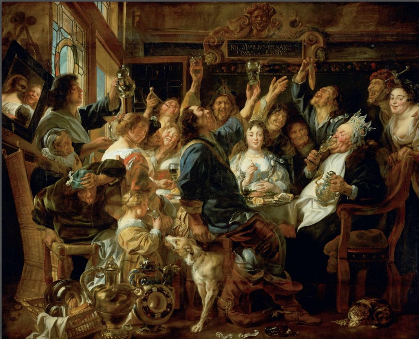
Праздник бобового короля. Художественно- исторический музей, г. Вена. Ок. 1665 г.