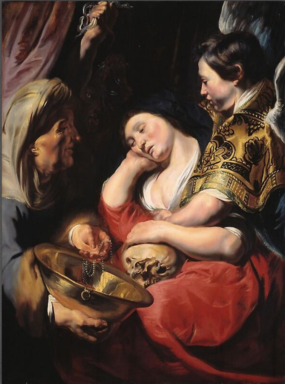
Искушение Марии Магдалины. Музей изящных искусств, г. Лилль. 1618 – 1620 гг.