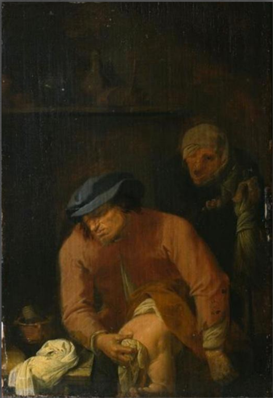
Неприятные отцовские обязанности. Картинная галерея, г. Дрезден. 30-е гг. XVII в.