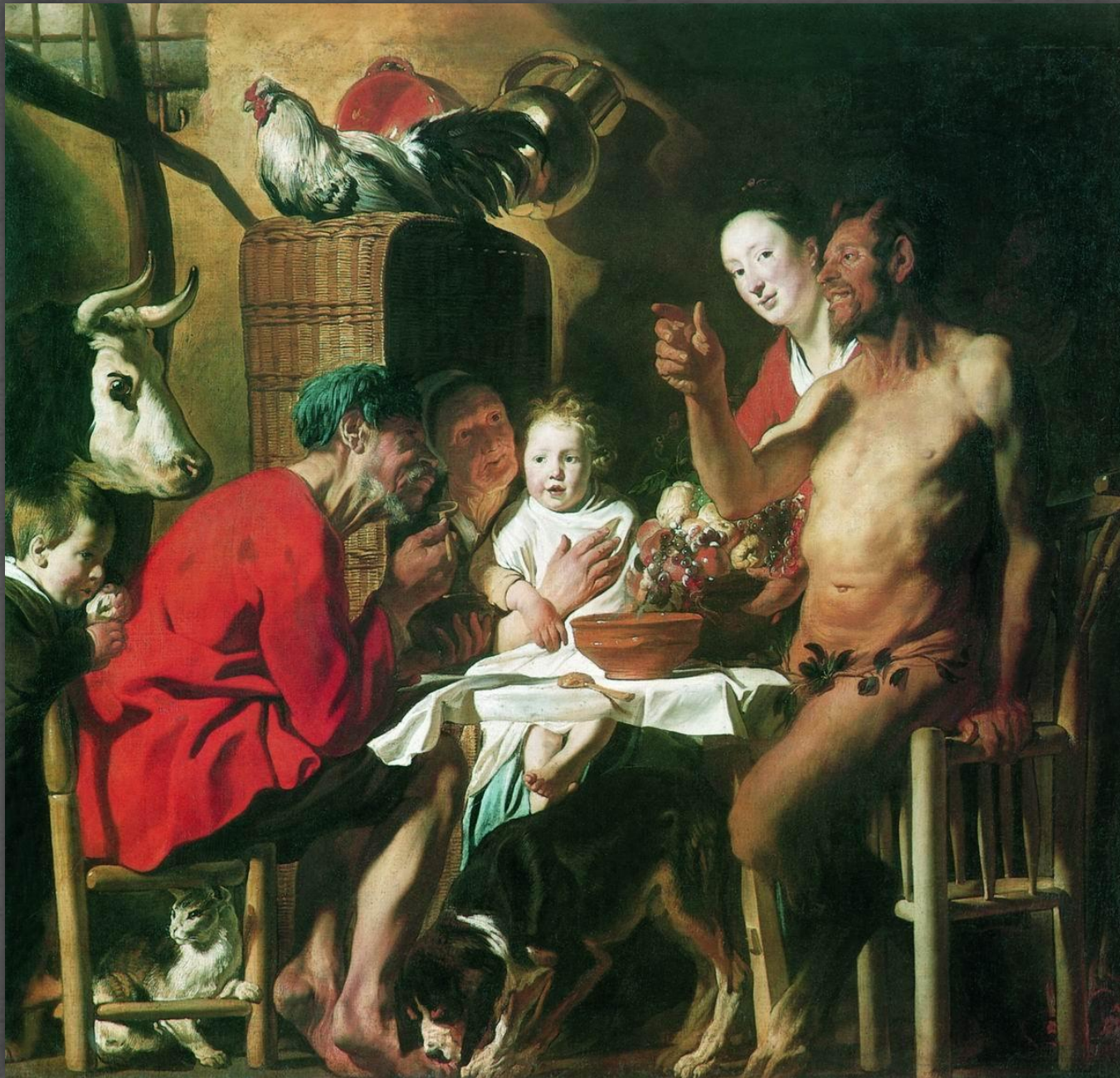
Сатир в гостях у крестьянина. Старая Пинакотекка, г. Мюнхен. Ок. 1622 г.