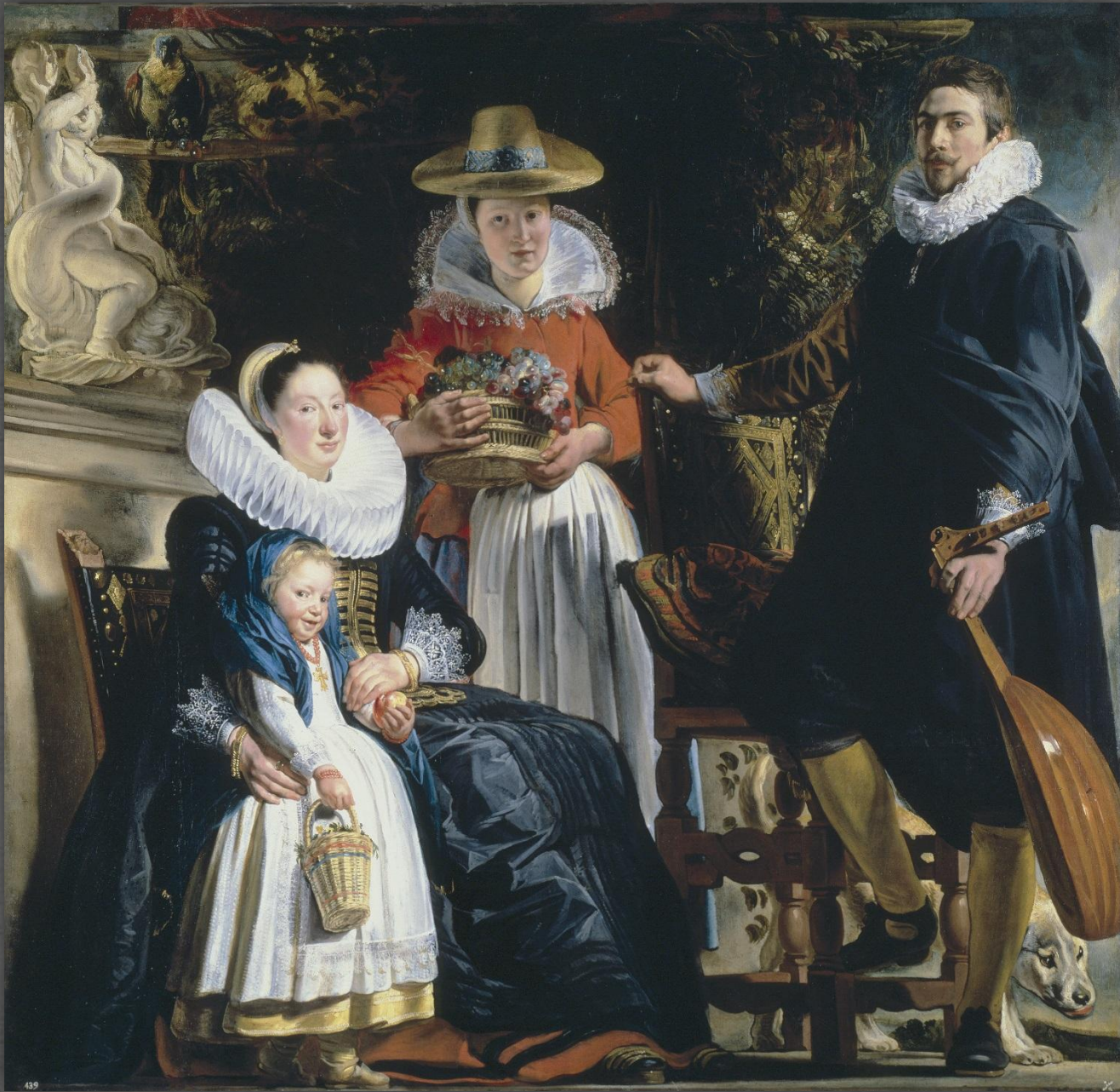
Семья Йорданс. Музей Прадо, г. Мадрид. 1621 г.