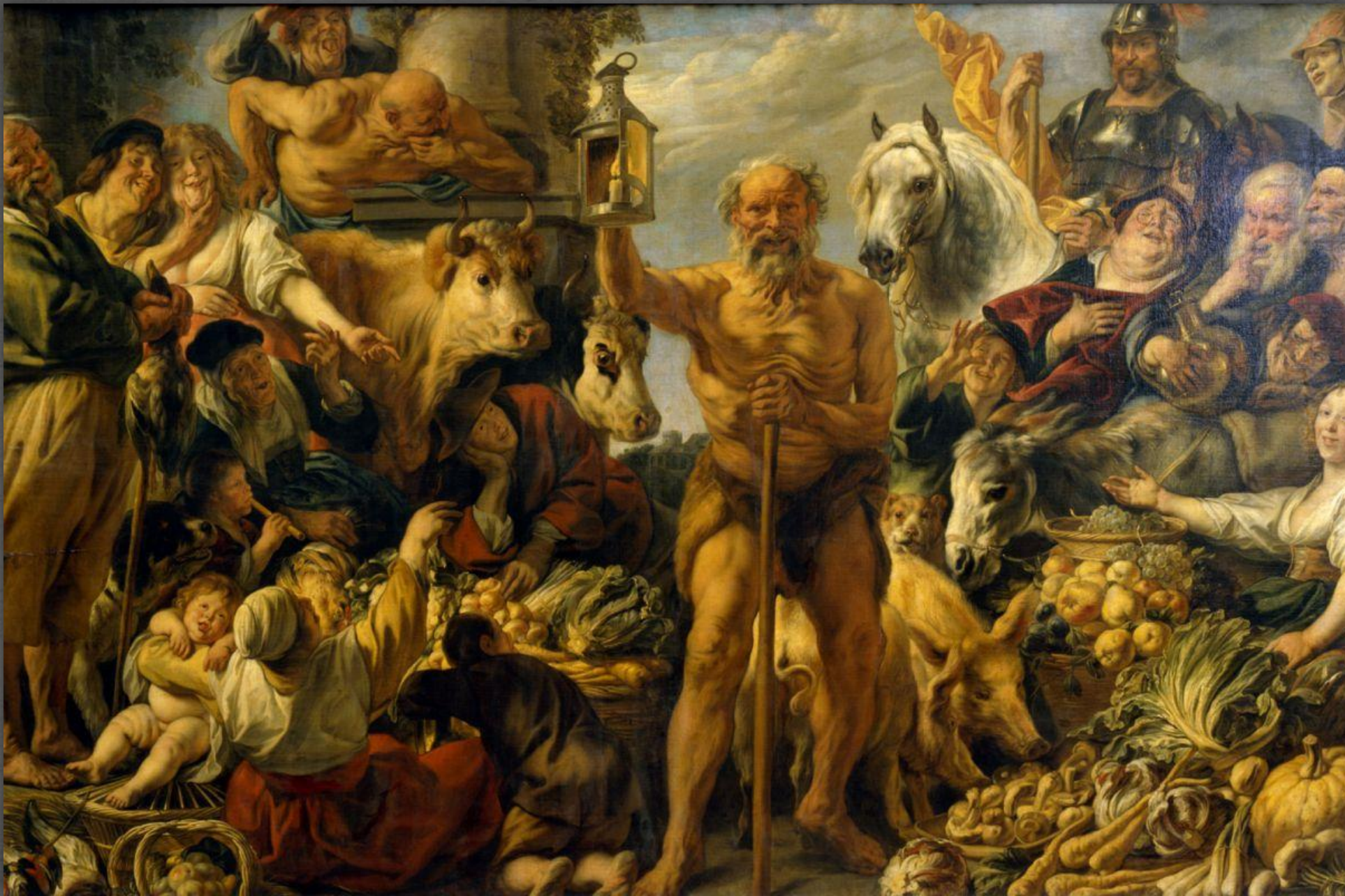
Диоген. Картина я галерея, г. Дрезден. Ок. 1643 г.