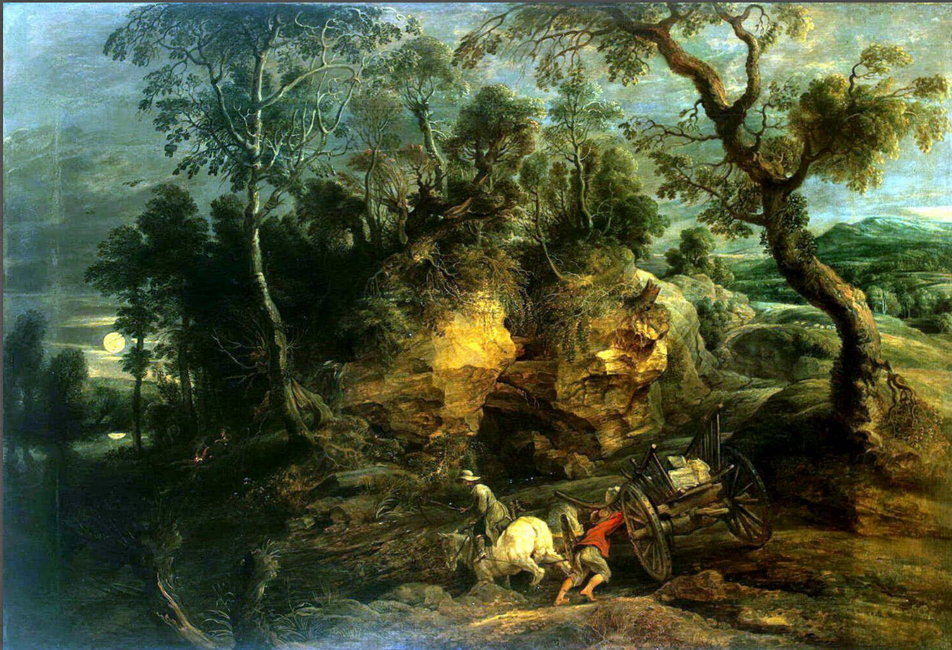
Возчики камней. Эрмитаж, г. СПб. 1620 г.