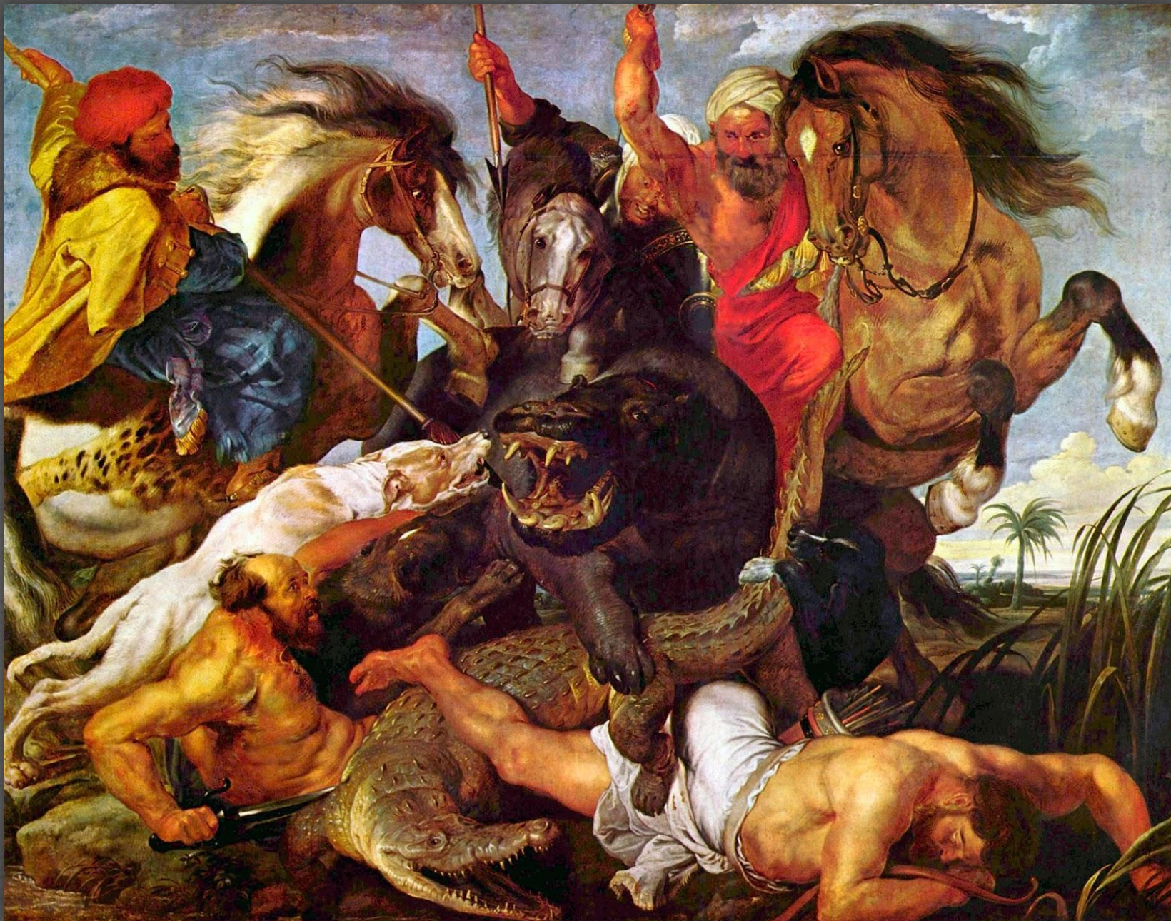
Охота на гиппопотамов и крокодилов. Старая Пинакотека, г. Мюнхен. 1615 – 1616 гг.