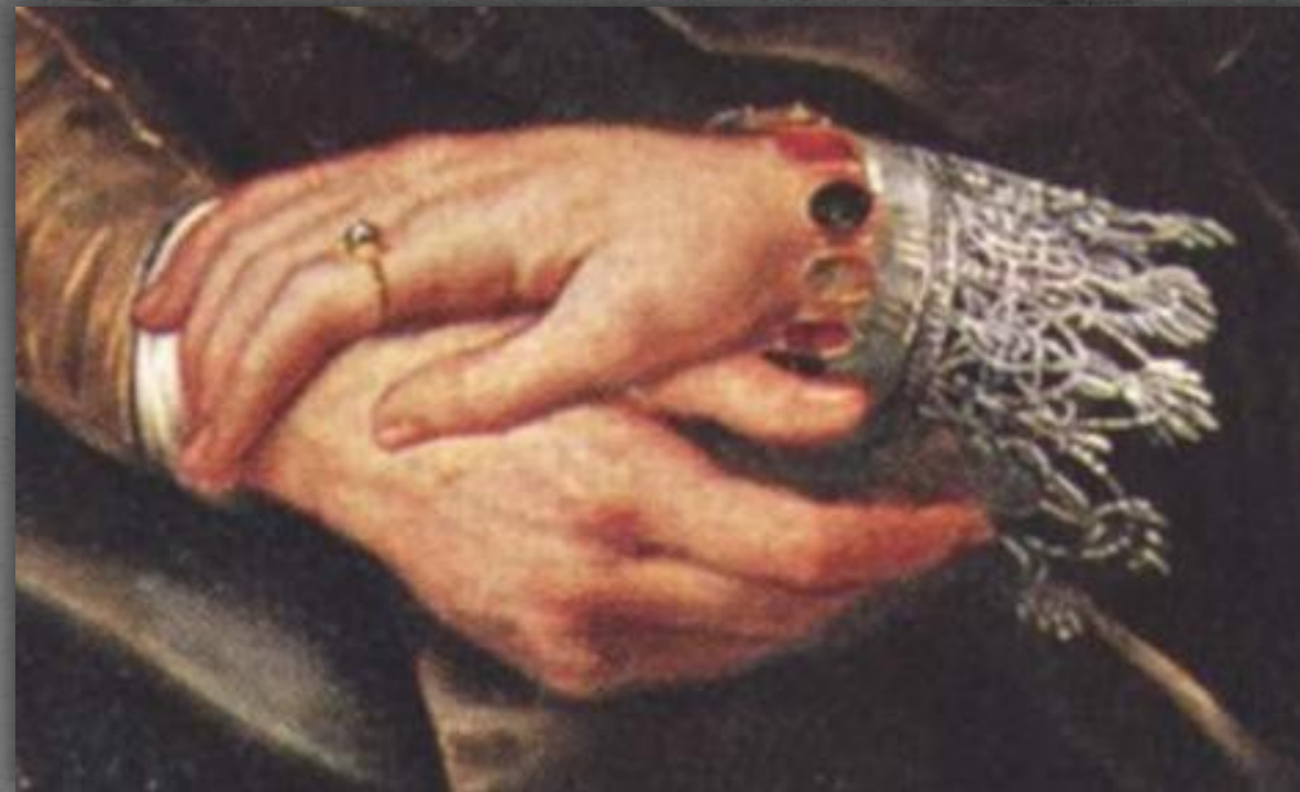
Жимолостная беседка или автопортрет с с Изабеллой Брант. Старая Пинакотека, г. Мюнхен. 1609 г.