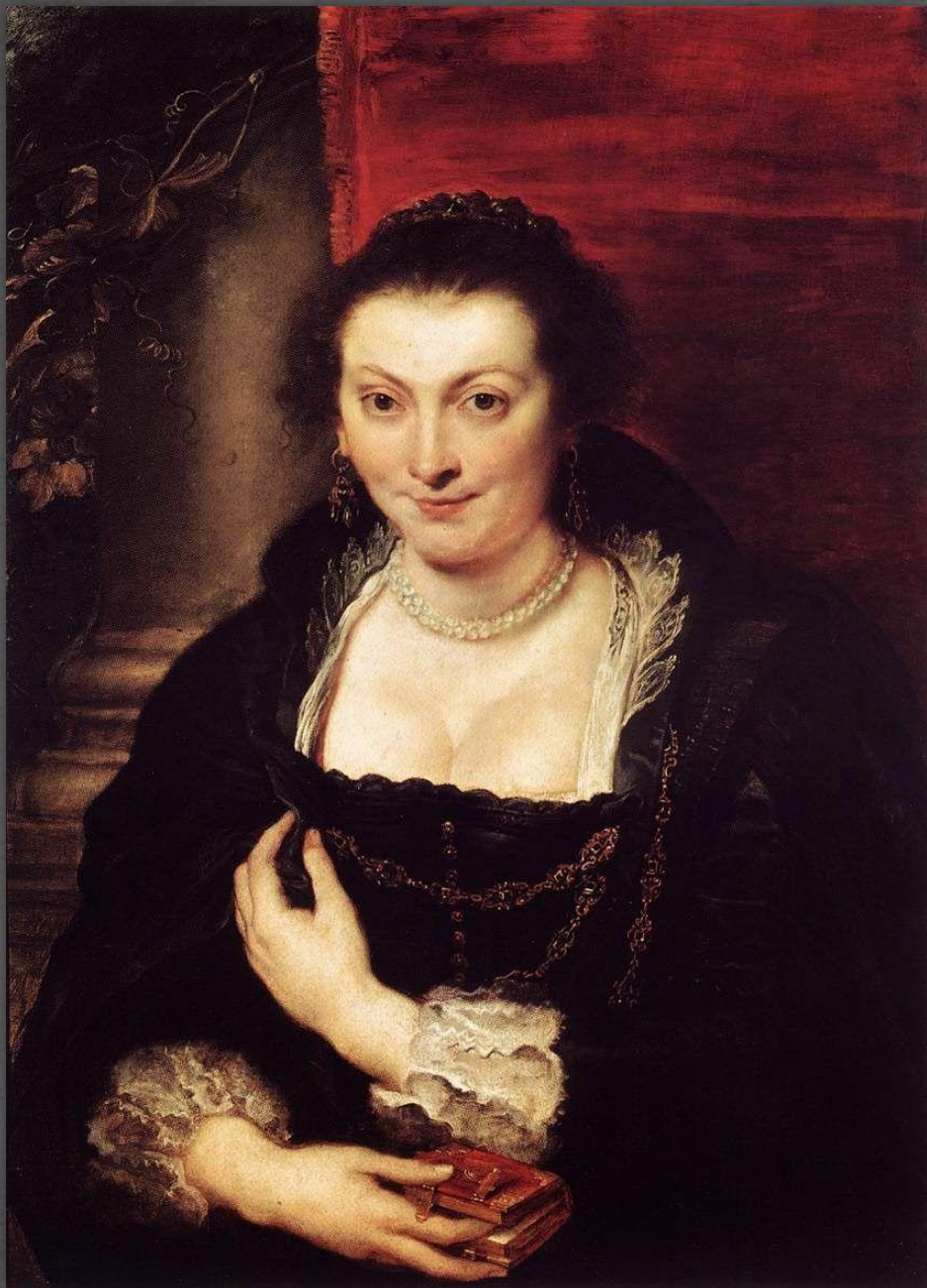
Портрет Изабеллы Брандт. Галерея Уффици, г. Флоренция. Ок. 1625 г.