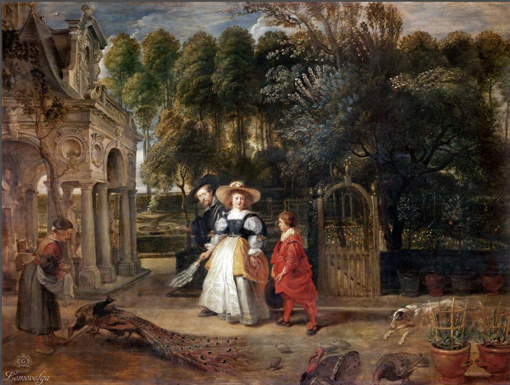
Портрет супругов Рубенс. Старая Пинакотека, г. Мюнхен. 1631 г.