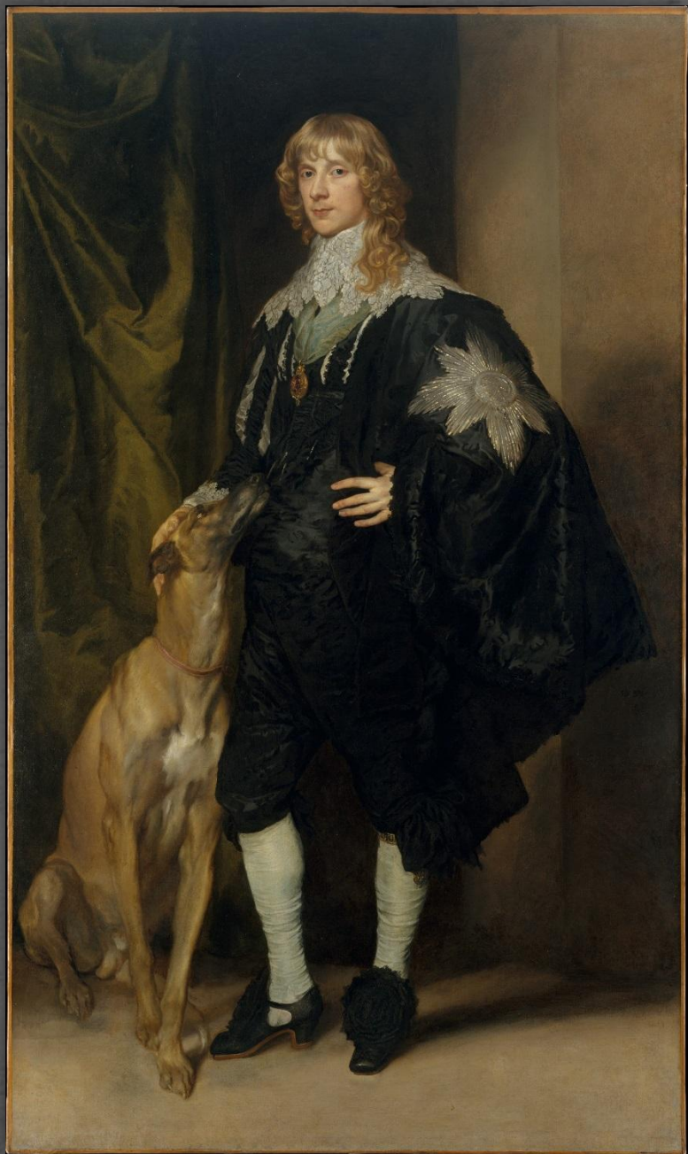
Портрет Джеймса Стюарта. Метрополитен музей, г. Нью-Йорк. 1634 – 1635 гг.