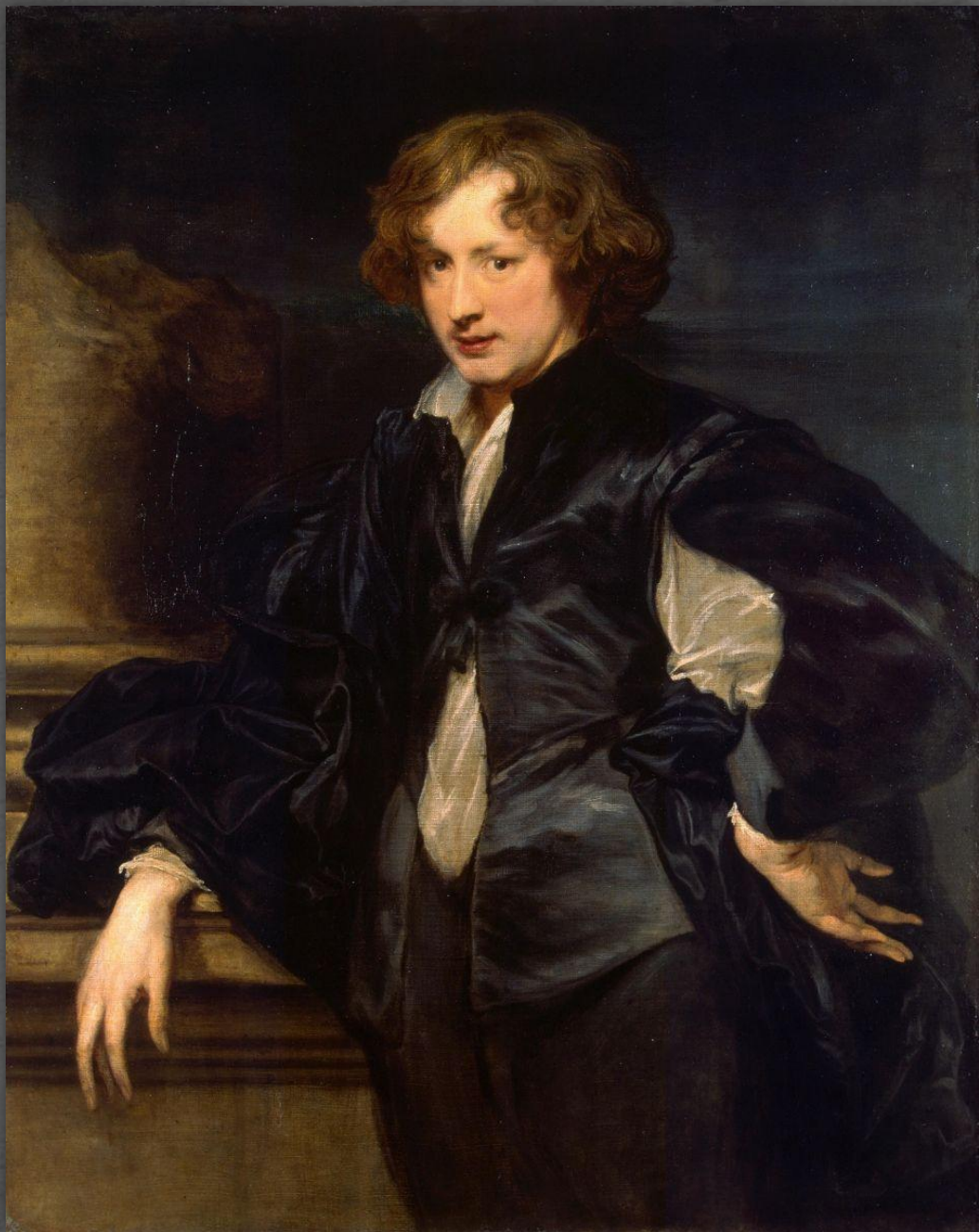
Автопортрет. Эрмитаж, СПб. 1622 г.