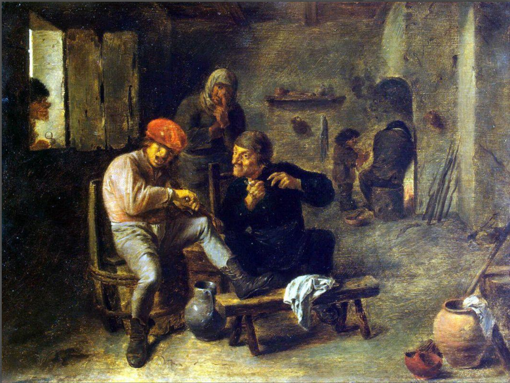
Сцена в кабачке. Эрмитаж, СПБ. Ок. 1632 г.