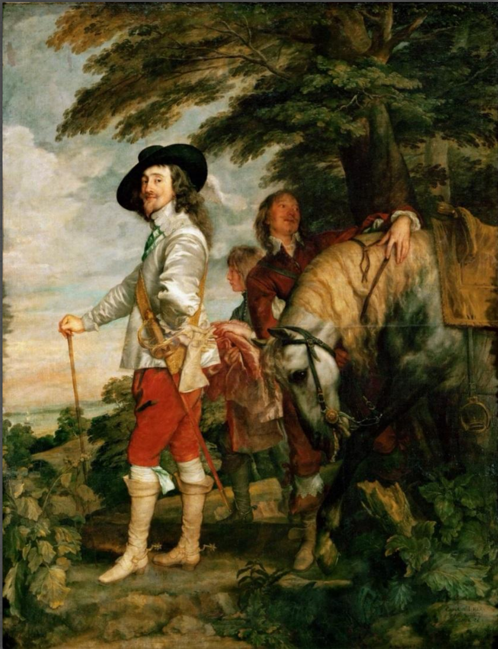
Портрет Карла I. Лувр, г. Париж. 1635 г.