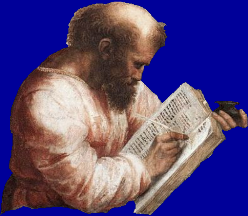
Пифагор (VI в. до н.э.)