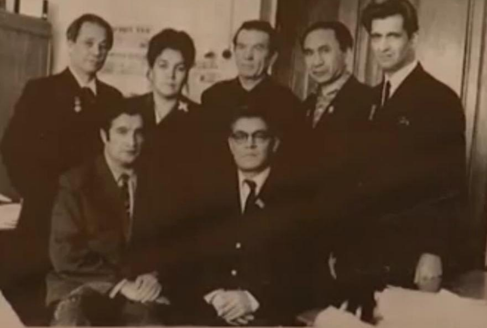
«Ақиқат» журналы редакциясы коллективі