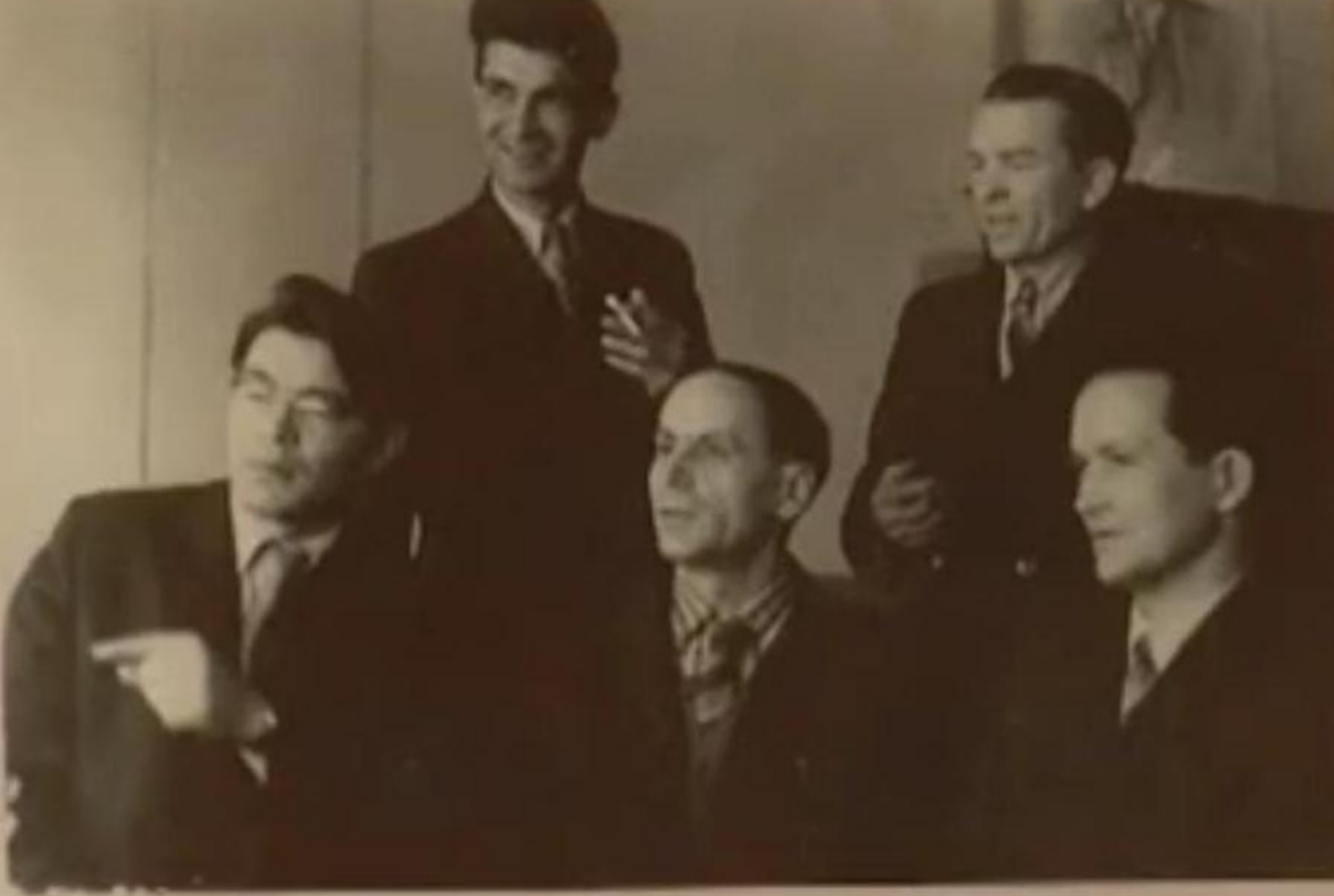
«Азәрбајҹан» журналы редакцияһында 1960 0ып, 30 0екабрь.