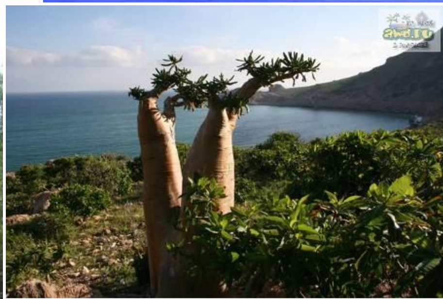
Бутылочное дерево — пахира водная