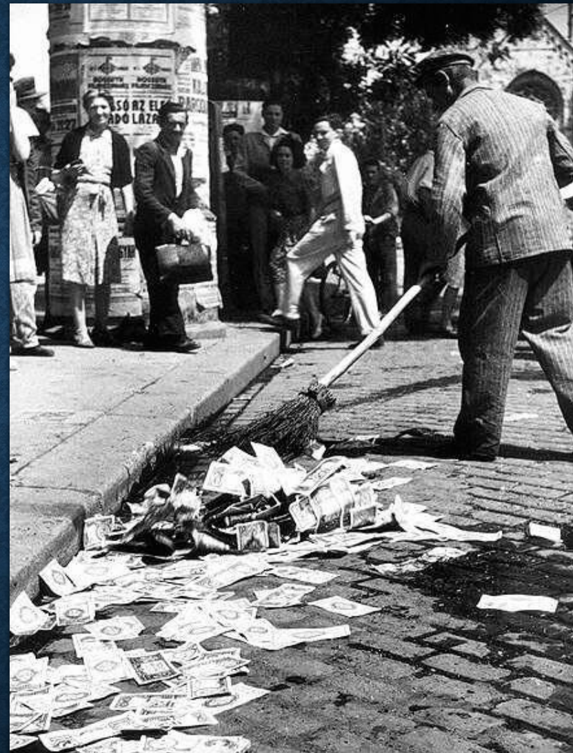
На фото: дворник в Венгрии подметает обесценившиеся банкноты, 1946г.

Самый рекордный темп роста инфляции в мире ( 42 \cdot 10^{19} \% ) имел место быть в Венгрии после окончания Второй мировой войны в 1945 году. Цены здесь удваивались каждые 15 часов.