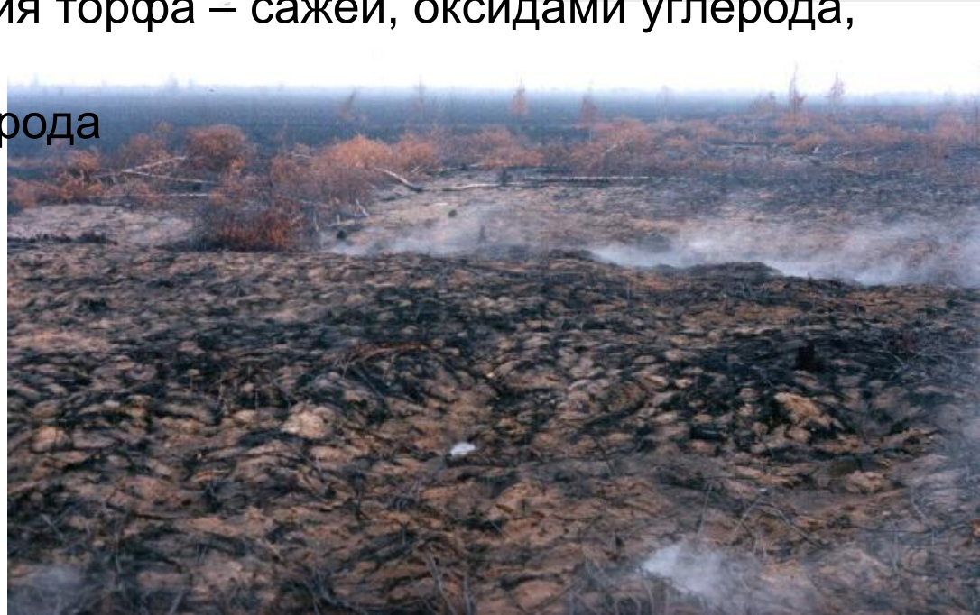
Рис 5. Последствия торфяного пожара [4]