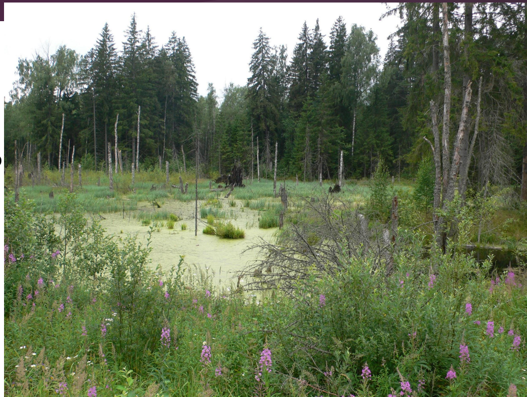
Рис 1. Болото на Валдае близ озера Селигер. [2]

Болото — участок ландшафта, характеризующийся избыточным увлажнением, повышенной кислотностью и низкой плодородностью почвы, выходом на поверхность стоячих или проточных грунтовых вод, но без постоянного слоя воды на поверхности. [1]