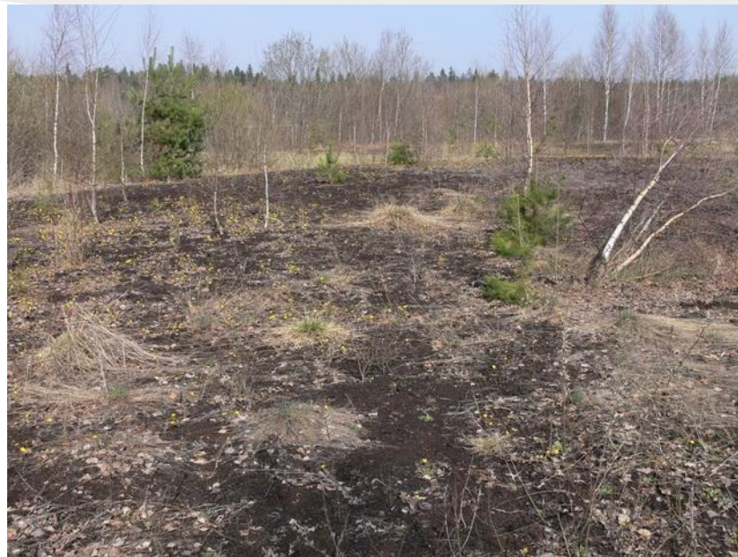
Рис 3. Осушенное болото Морочно до обводнения. 2006 год. [4]

Осушение болот — мероприятия по снижению уровня грунтовых вод и уменьшению влажности верхних слоёв почвы в рамках мелиорации. [3]