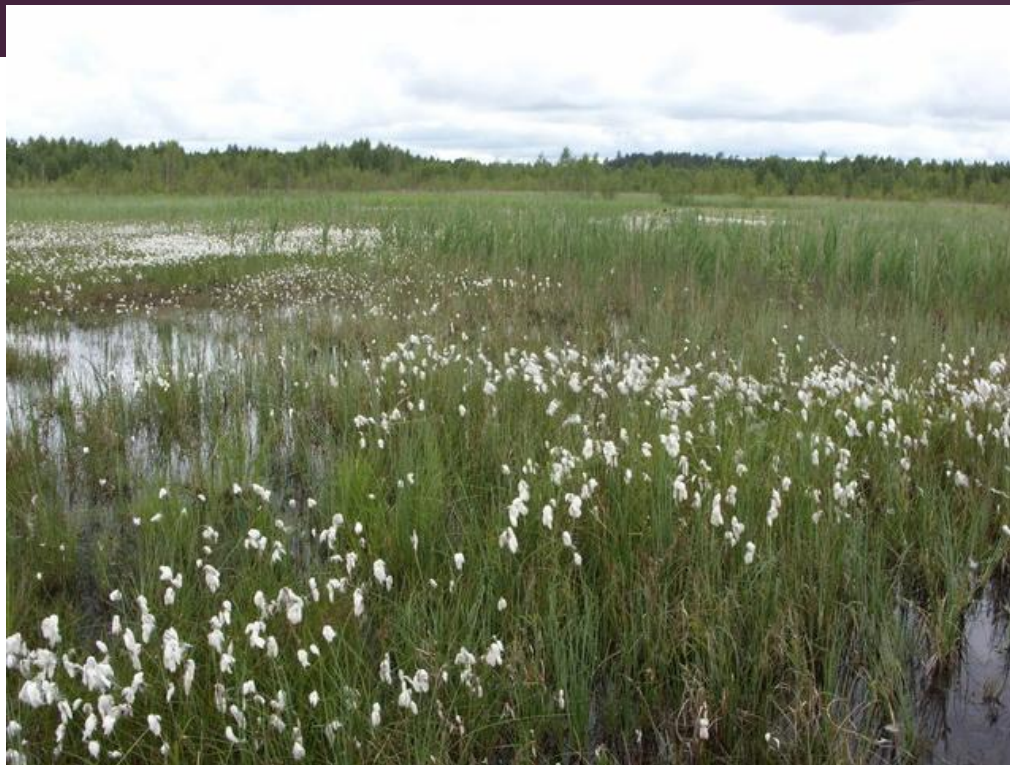
Рис 6. Восстановленное болото Морочно после обводнения. 2009 год. [4]