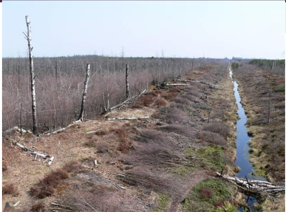
Рис 4. Пример неудачной мелиорации [4]