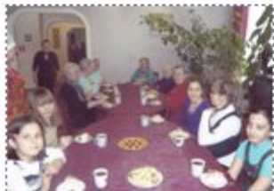
В Центре Дневного пребывания пенсионеров

Ученики 6-х классов встретились со старейшими жителями села, посетили Центр Дневного пребывания пенсионеров, где был дан небольшой концерт.