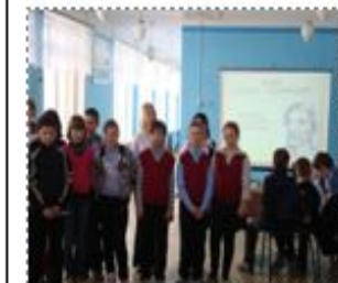
5 Б класс

Эстафету в проведении школьных линеек от 5-х классов принял 10 класс. Ребята рассказали о Ледовом побоище