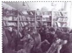
В сельской библиотеке

С пятиклассниками была проведена историческая игра «Путешествие по странам Древнего Востока». А вот самым смелым стал среди историков выигрывать параллели 7-х классов. Старшеклассники посетили сельскую библиотеку, где для них был проведен исторический библиотечный урок,