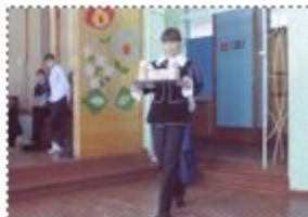
Торжественно: 9Б класс