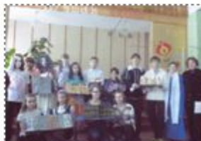
Активные участники недели