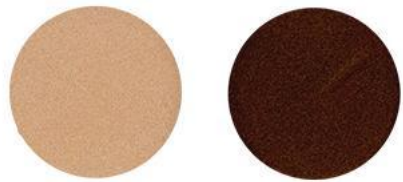
5. Кремовый жемчуг\ Коричневый топаз