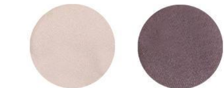
1. Розовый жемчуг/ Аметист