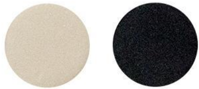
4. Белый жемчуг\ Чёрный агат