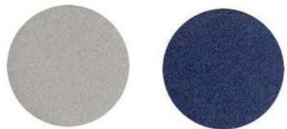
2. Серебро/ Сапфир