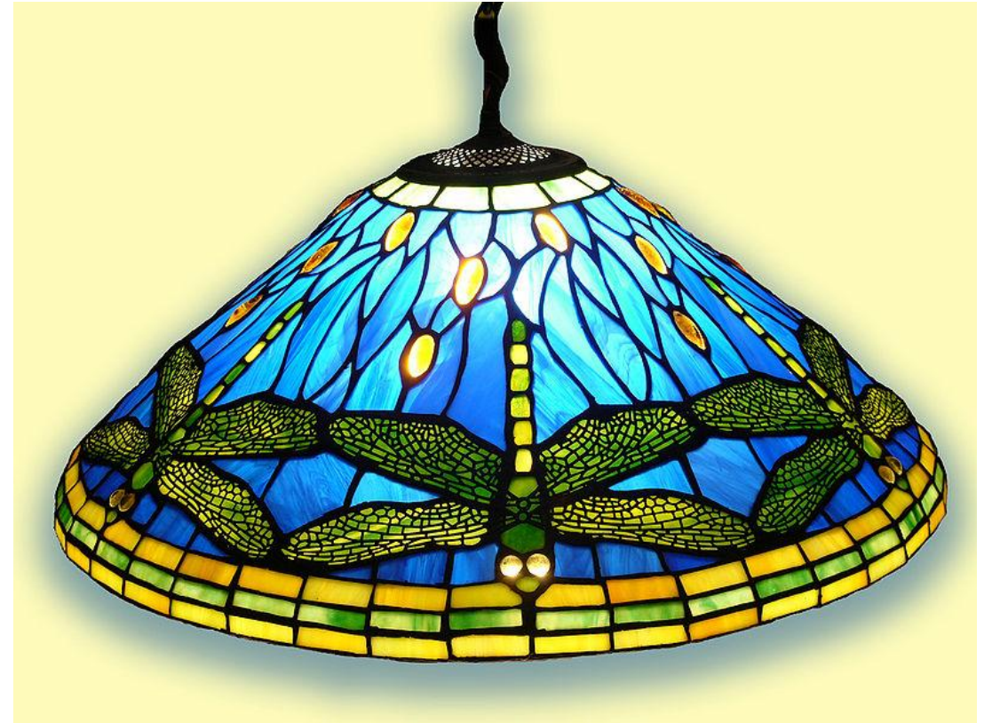
Lampenschirm von Tiffany «Dragonfly»