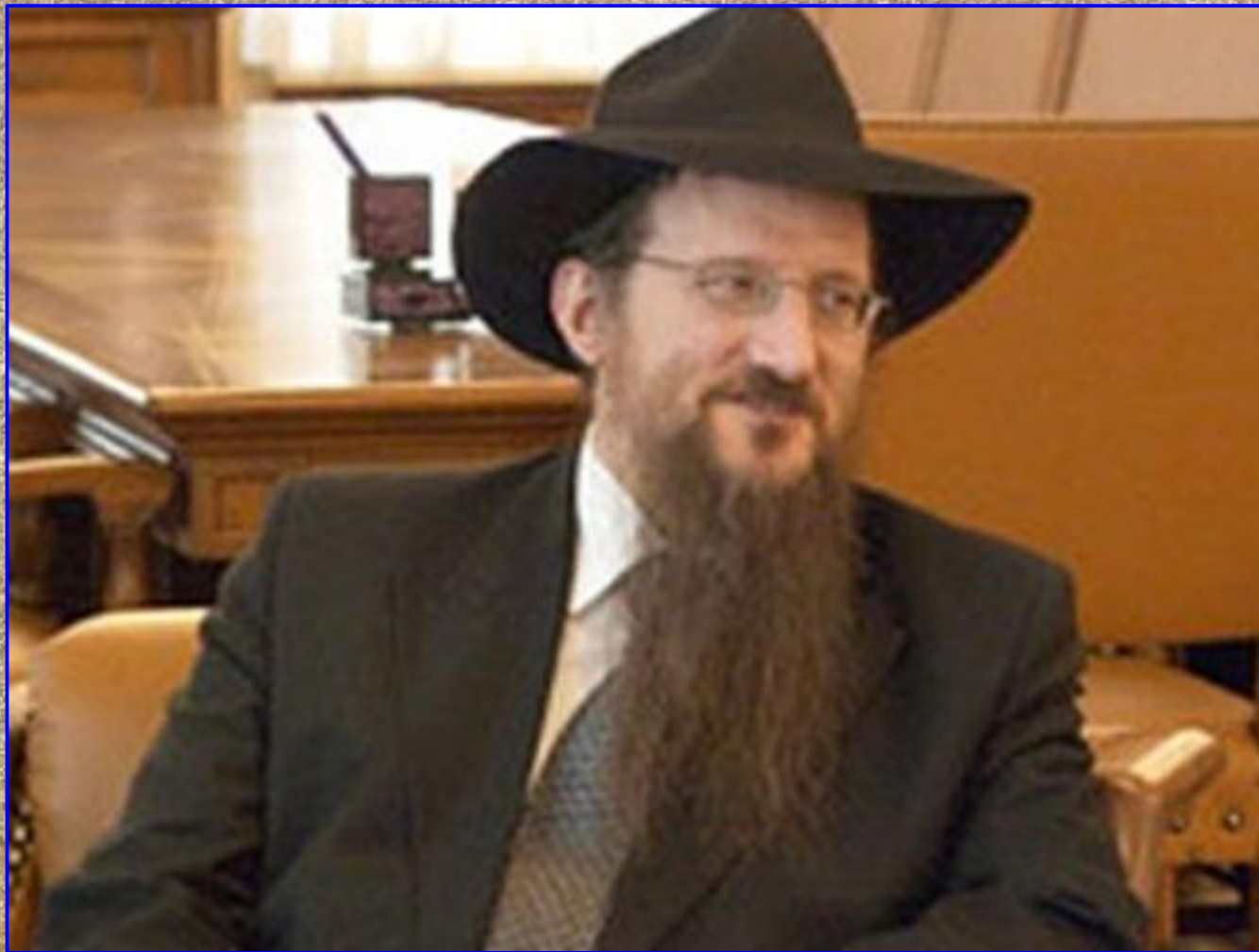
Главный раввин России – Берл Лазар.