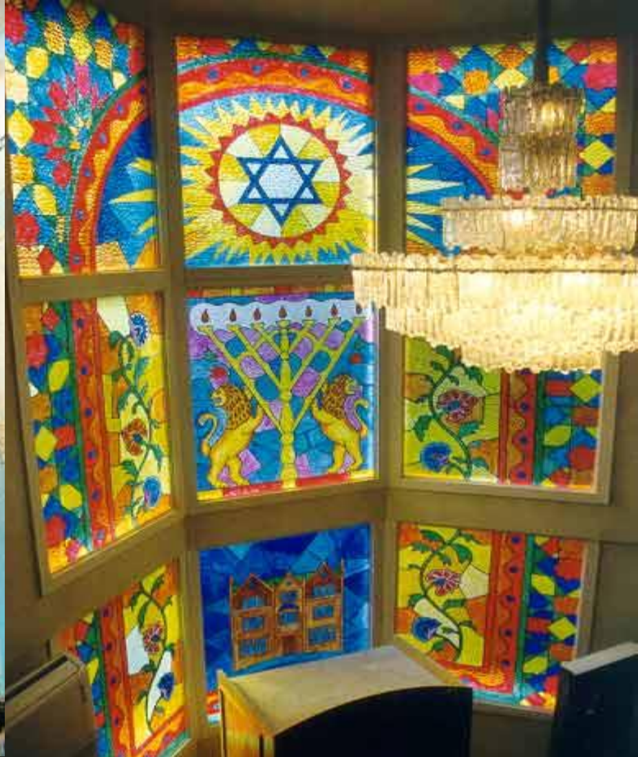
Внутреннее убранство синагоги.