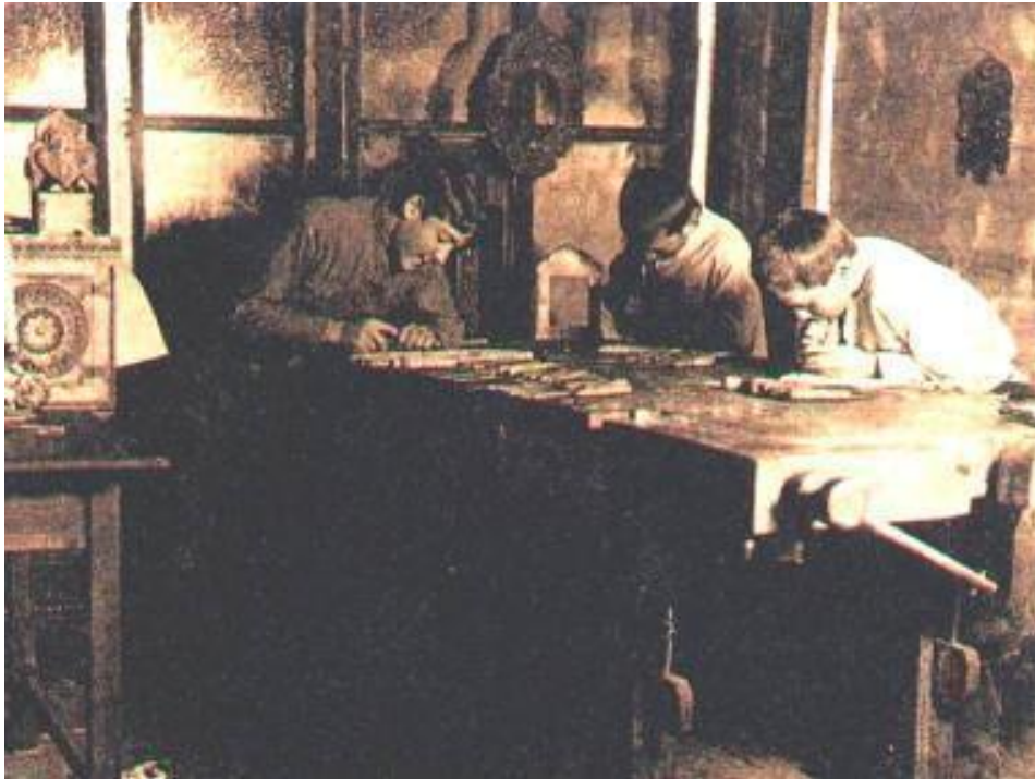
Ученики в ремесленной мастерской

Александр III заложил основы рабочего законодательства.