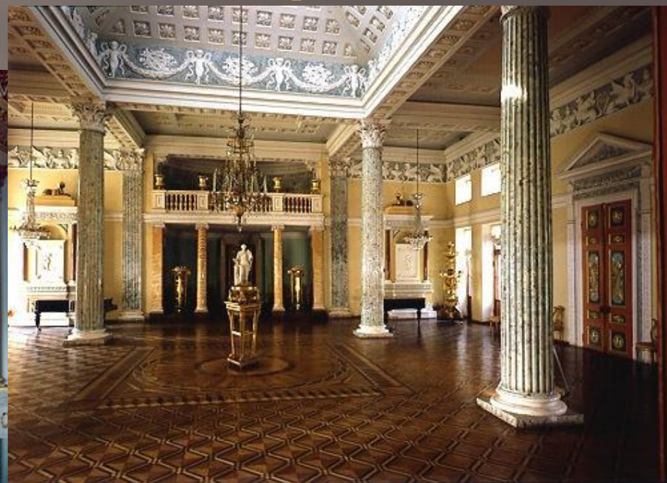
Зал Останкинского Дворца