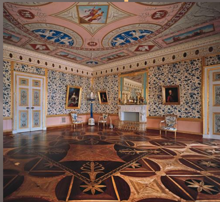
Парадная голубая гостиная