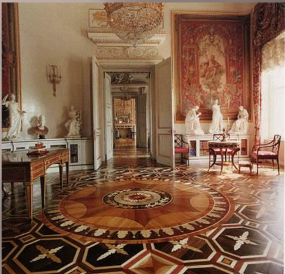
Библиотека Марии Федоровны