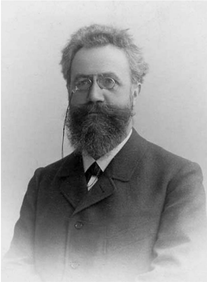
Герман Эббингауз (1850-1909)