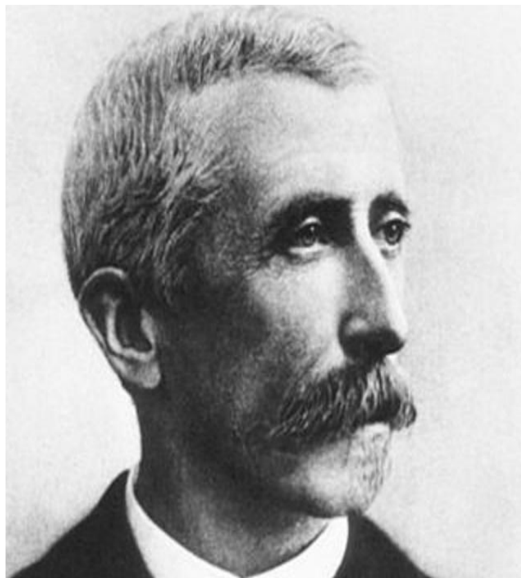
Теодюль Рибо (1839-1916),