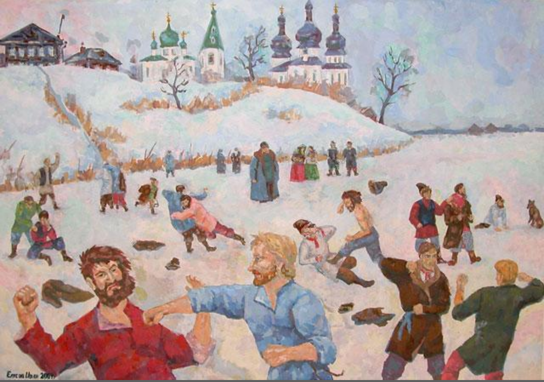
Ernst Lubitsch 2009