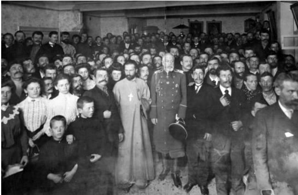
Открытие Коломенского отдела легального «Собрания», 1904 год. На фото рядом стоят священник Гапон, градоначальник И. Фулон и революционеры