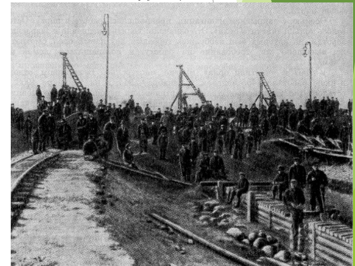
Общественные работы в СПб порту, 1907 год