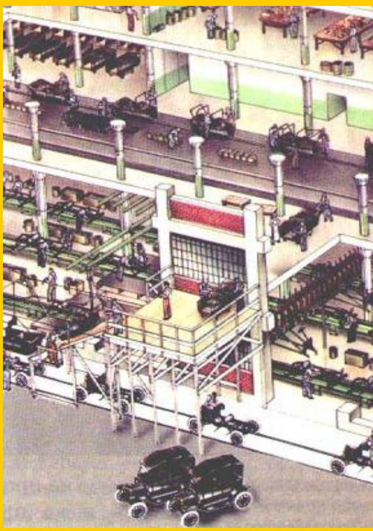
Конвейер на заводе Форда

США стали родиной автомобилестроения. В 1892 г. Г.Форд создал свой первый автомобиль и вскоре запустил его в серийное производство.