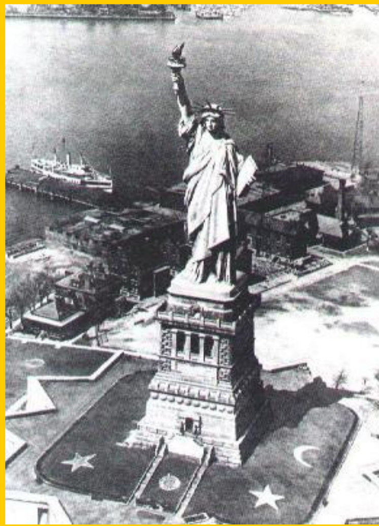
Статуя Свободы. 1886 г.

После Гражданской войны перед правительством США встала задача заменить систему общественных отношений на Юге ( Реконструкция )