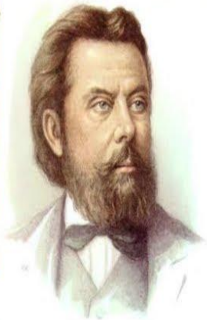
Модест Петрович Мусоргский