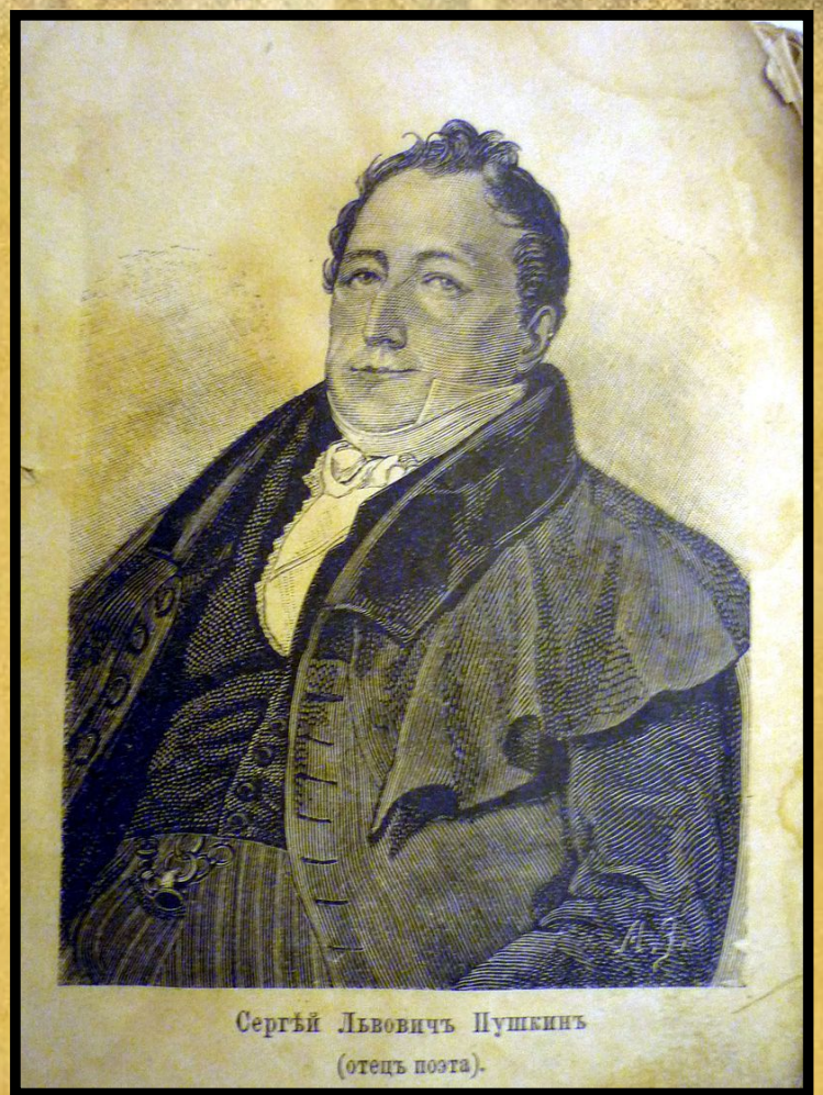
Сергей Львович Пушкин (отец поэта).

Надежда Осиповна Ганнибал – мать поэта. Была образована, остроумна, хороша собой, любила развлечения и блистала на балах.