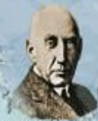
Р. Адмундсен 1912 г.