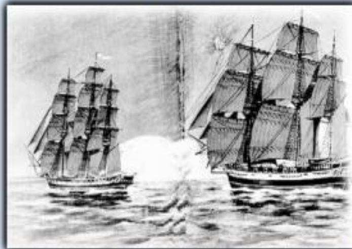
Шлюпы Восток и Мирный

Антарктида была открыта последней из материков Земли. Существование Южного материка предполагалось очень давно, на старинных картах его часто объединяли с Южной Америкой или с Австралией, получившей название в честь этой гипотетической части суши. И только экспедиция Беллинсгаузена и Лазарева в южно-полярных морях на шлюпах «Восток» и «Мирный» подтвердила факт наличия шестого материка Земли. Это случилось 16 (28) января 1820 года (официальная дата открытия Антарктиды) в районе современного шельфового ледника Беллинсгаузена.