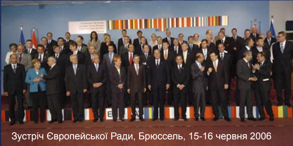
Зустріч Європейської Ради, Брюссель, 15-16 червня 2006

До складу Ради входять глави держав та урядів країн Європейського Союзу