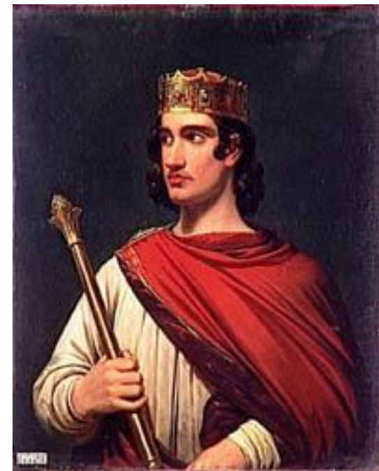
Лотарь – старший внук Карла Великого