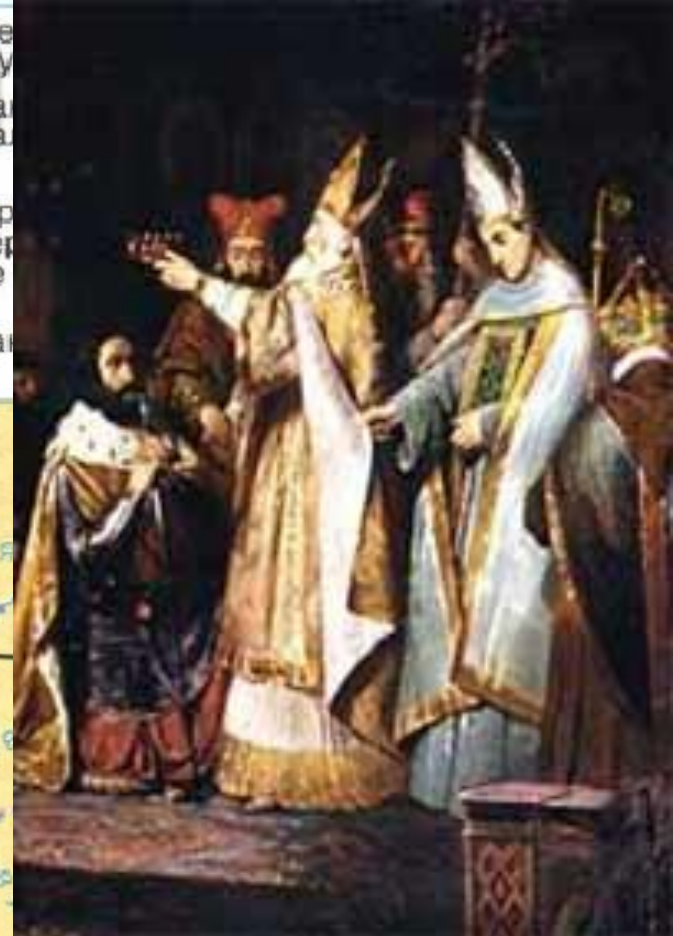
774 г. - Коронация карла на королевство лангобардов