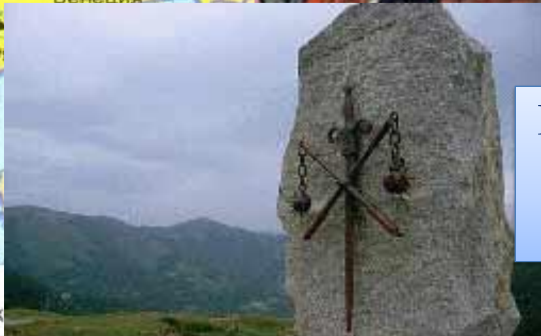
Карл Великий провожает Роланда