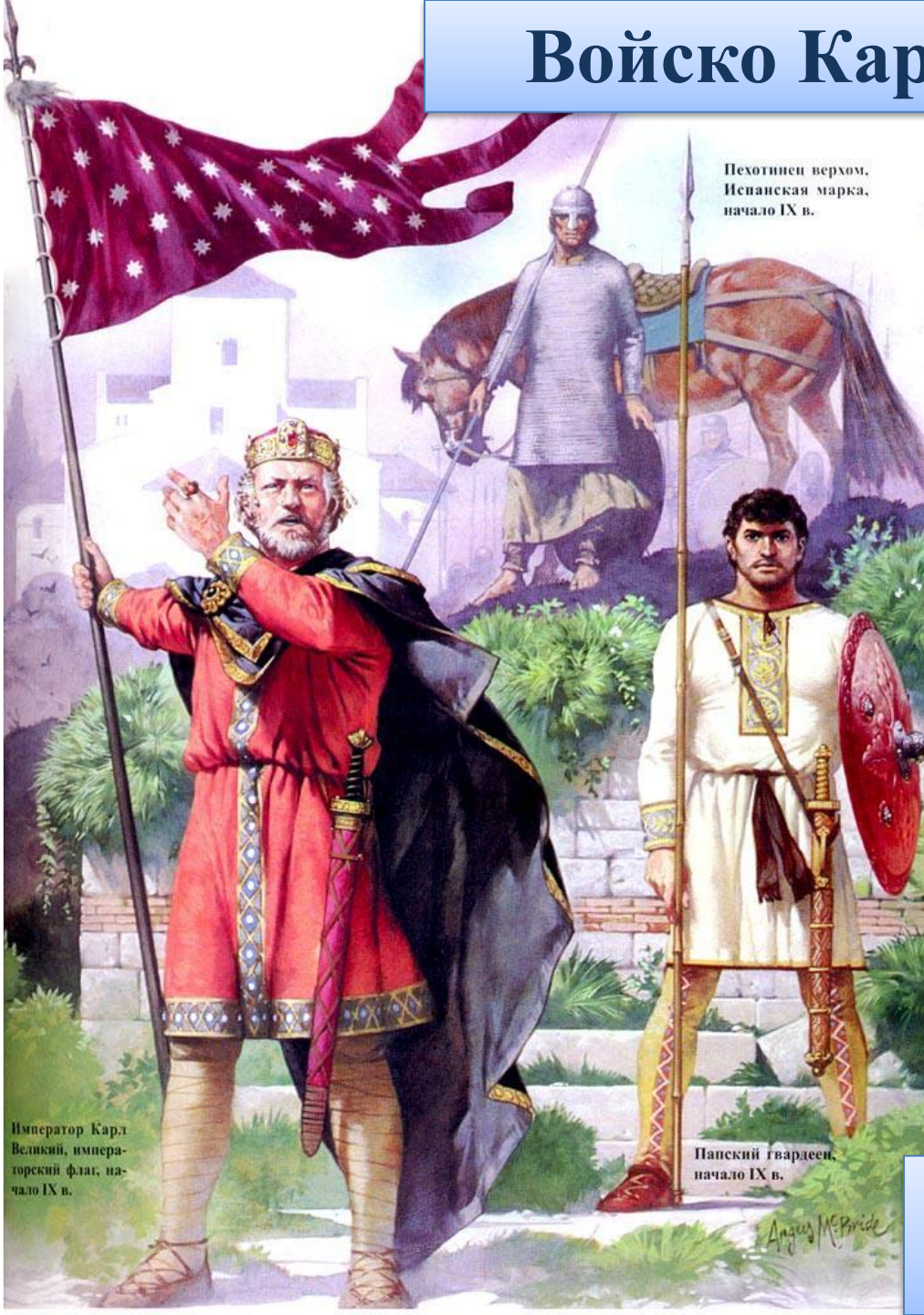
Пехотинец верхом, Испанская марка, начало IX в.