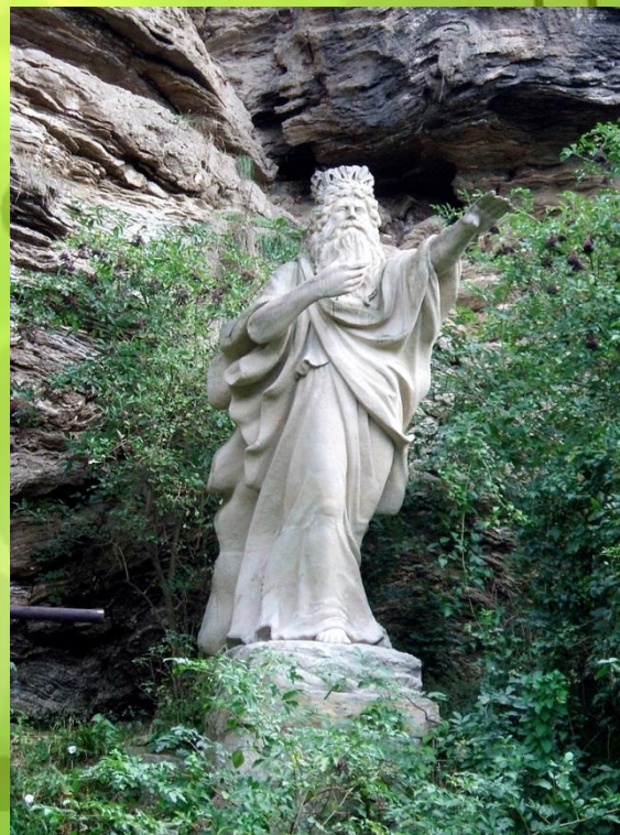
Скульптура лесного царя в г. Йене

В 1815 году 18-летний композитор Франц Петер Шуберт написал песню «Лесной царь». В датском и немецком фольклоре фигура Лесного царя ассоциируется со смертью. Действие в балладе происходит ночью, когда господствует тьма: «под хладною мглой», «в ночной глубине», «темные ветви»