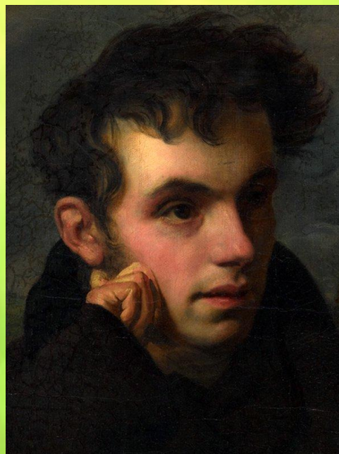
Василий Андреевич Жуковский (1783-1852) Русский поэт, писатель. переводчик