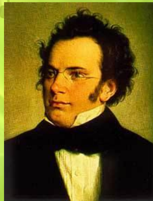
Франц Петер Шуберт (1797-1823) Австрийский композитор