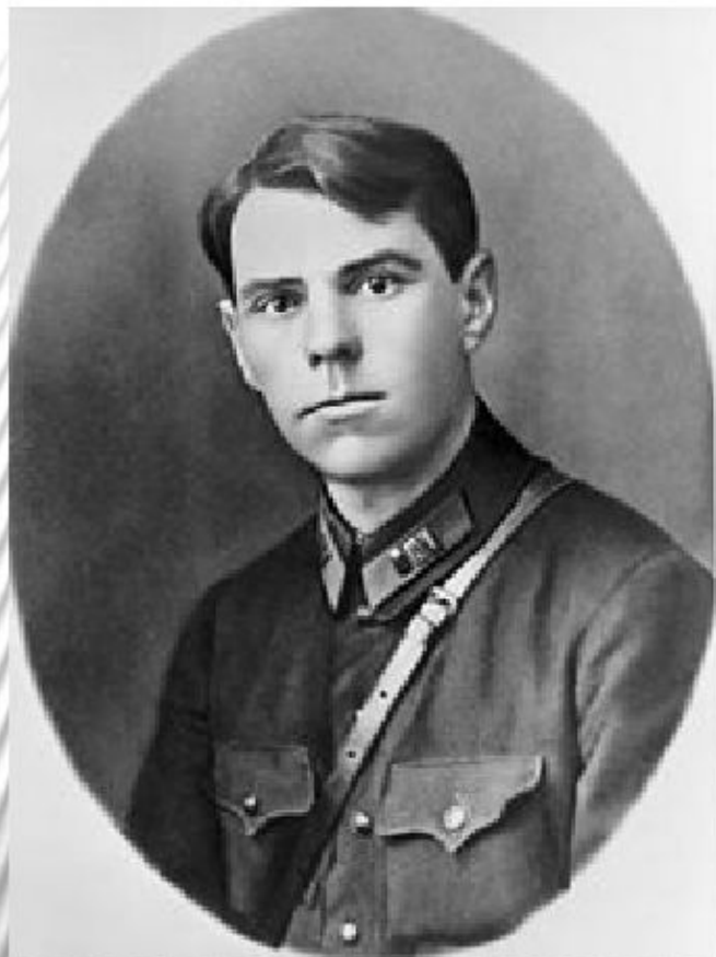
Командир полка А.М. Василевский. 1928 год