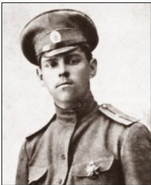
Прапорщик А. Василевский. 1915 г.