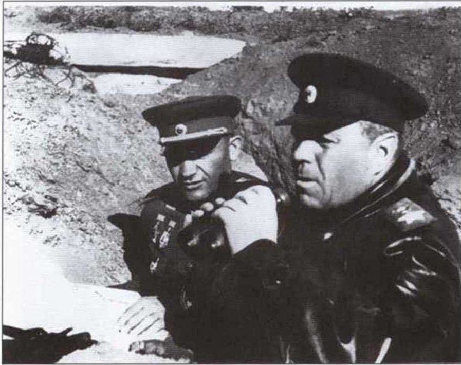
С Яковом Григорьевичем Крейзером , командующим 51 армией