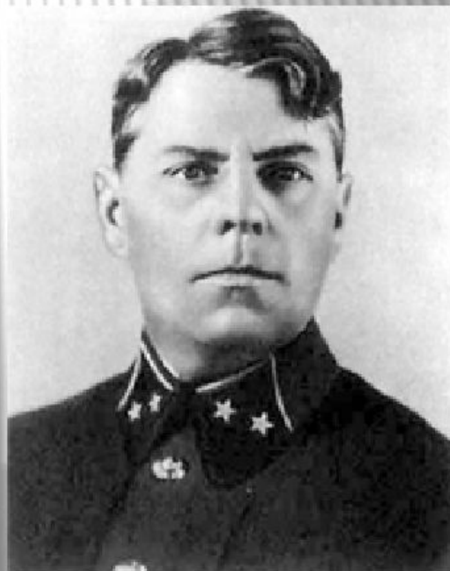
Начальник отделения оперативной подготовки Генерального штаба комбриг А.М. Василевский. 1938 год.