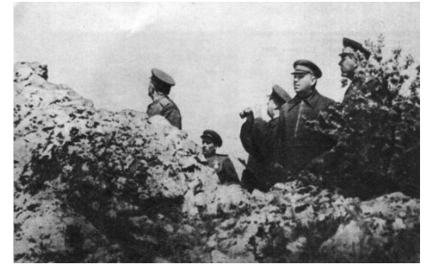
После взятия Севастополя