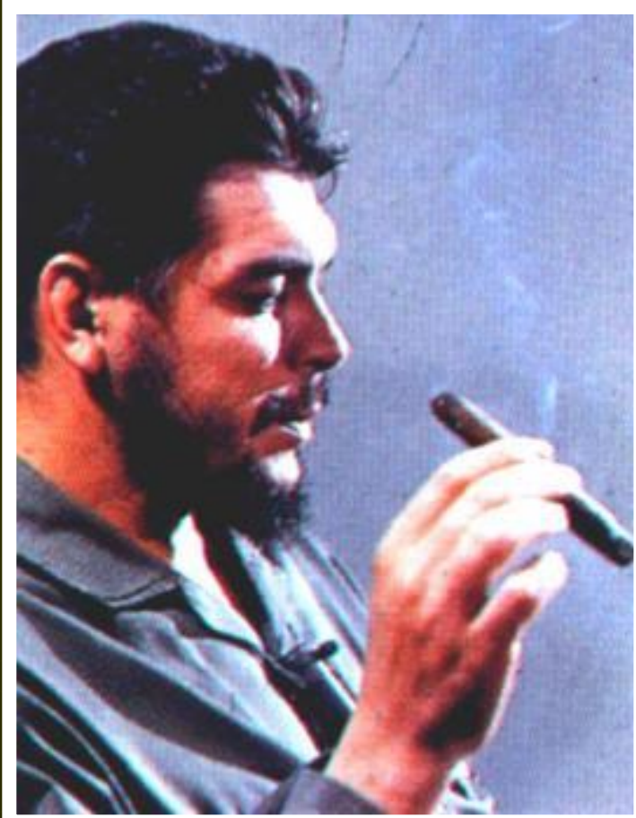
Эрнесто Че Гевара.

Чегевара был выходцем из Аргентины. Несмотря на астму, он много путешествовал и победил болезнь. Увлеченный идеями Ленина, Че познакомился с Кастро и принял активное участие в кубинской революции. Че был сторонником сближения с СССР, но после Карибского кризиса, выступил с идеей втянуть империализм в непосильные для него войны и отправился в Боливию.