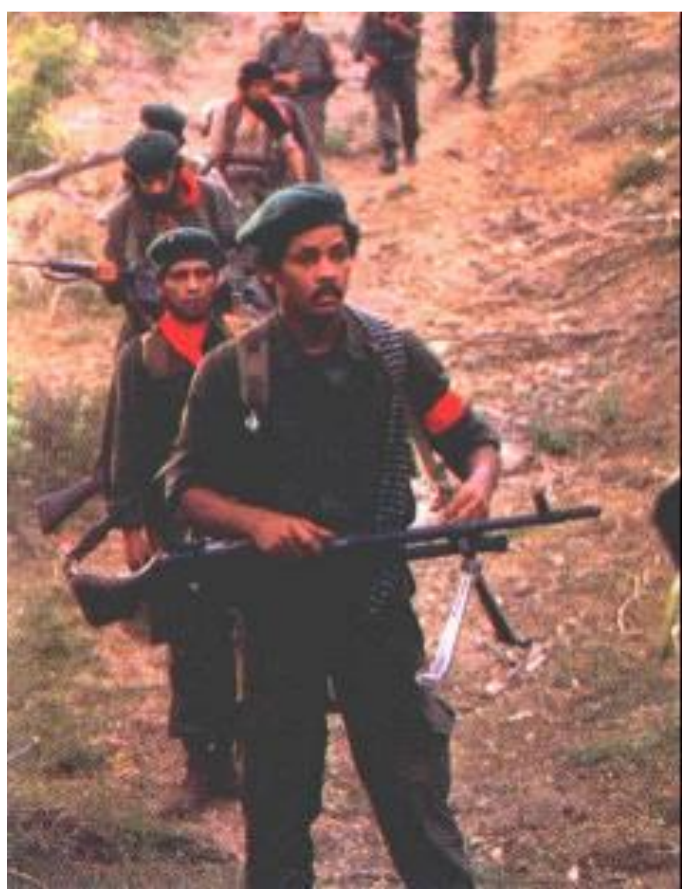
Сандинисты в Никарагуа

В Никарагуа правил диктатор Самоса. Под влиянием кубинской революции здесь началась партизанская борьба сандинистского ФНО. в 1978 г. полиция убила лидера либералов П.Чаморо и в стране началось восстание. В июле повстанцы заняли Манагуа и страну возглавил Д. Ортега.