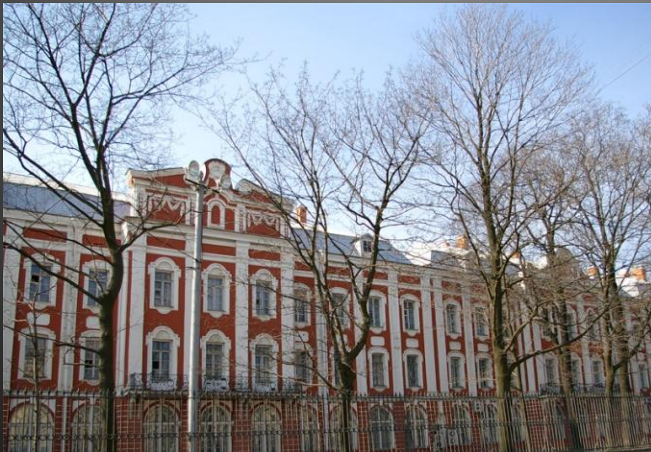
Здание двенадцати коллегий