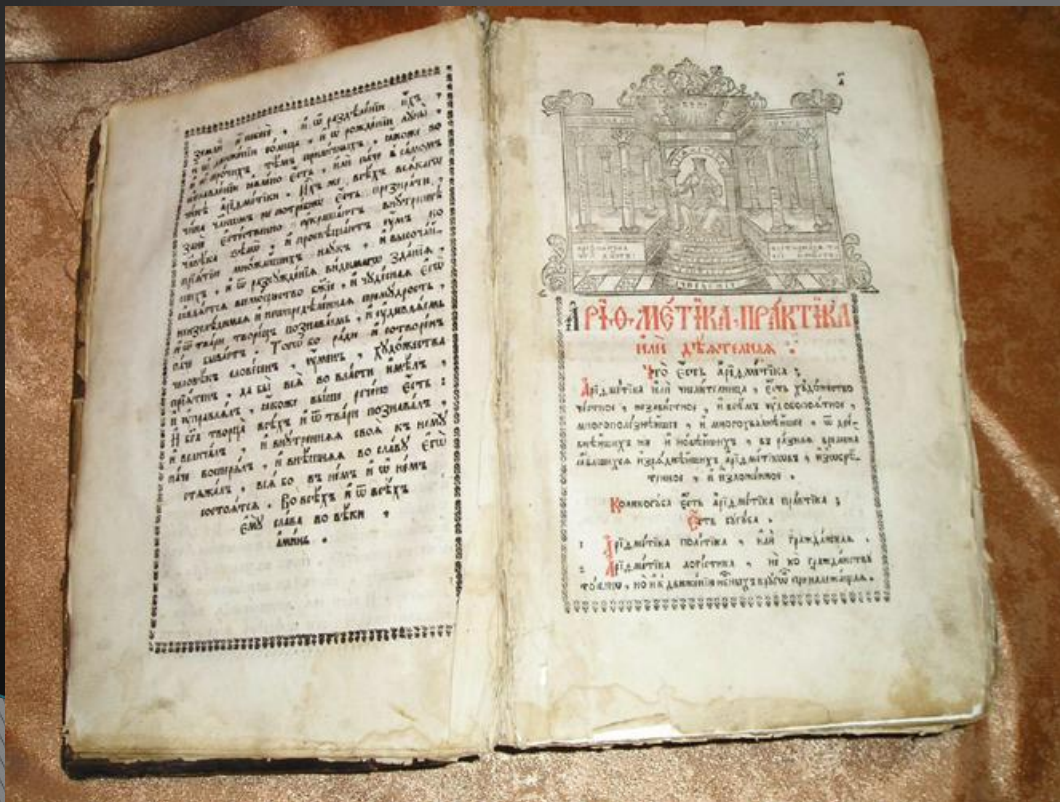
Арифметика Леонтия Магницкого (1703г.)

Содержание обучения изменилось. На первом месте оказались те предметы, которые давали полезные для практики знания: математика, астрономия, инженерное дело, фортификация.