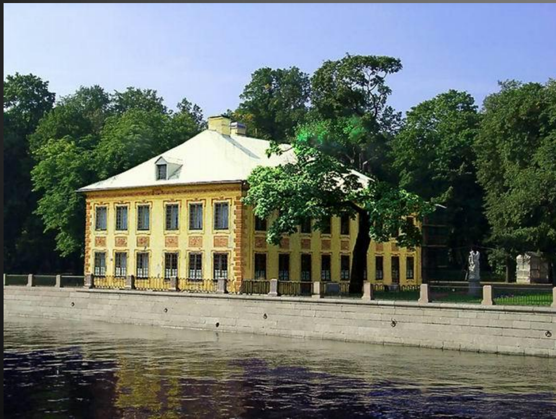
Летний домик Петра

Раннее барокко (монументальность, сочетающаяся с пышностью)