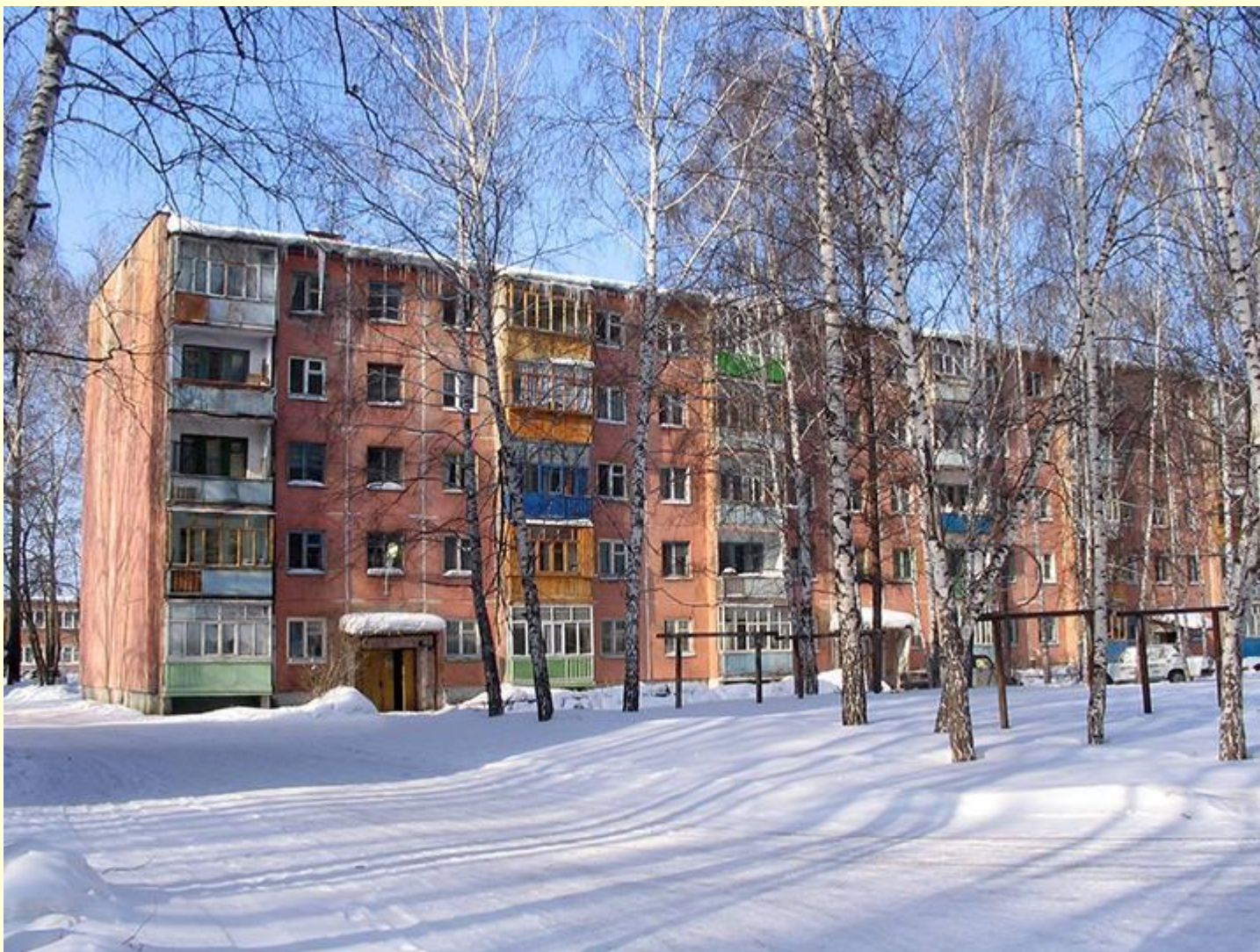
«Хрущевка». Современное фото. Улица Кулагина, Томск