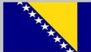
Босния и Герцеговина