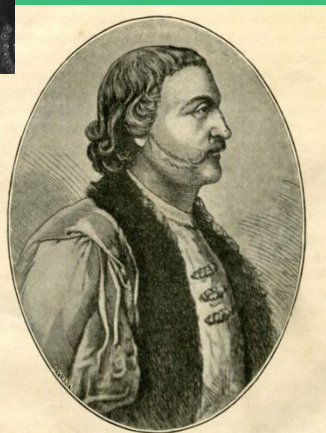
Князь Борис Алексеевич Голицын, во иноках Боголюб, воевода Казанский, сводный брат Петра I-го (из стр. 85).