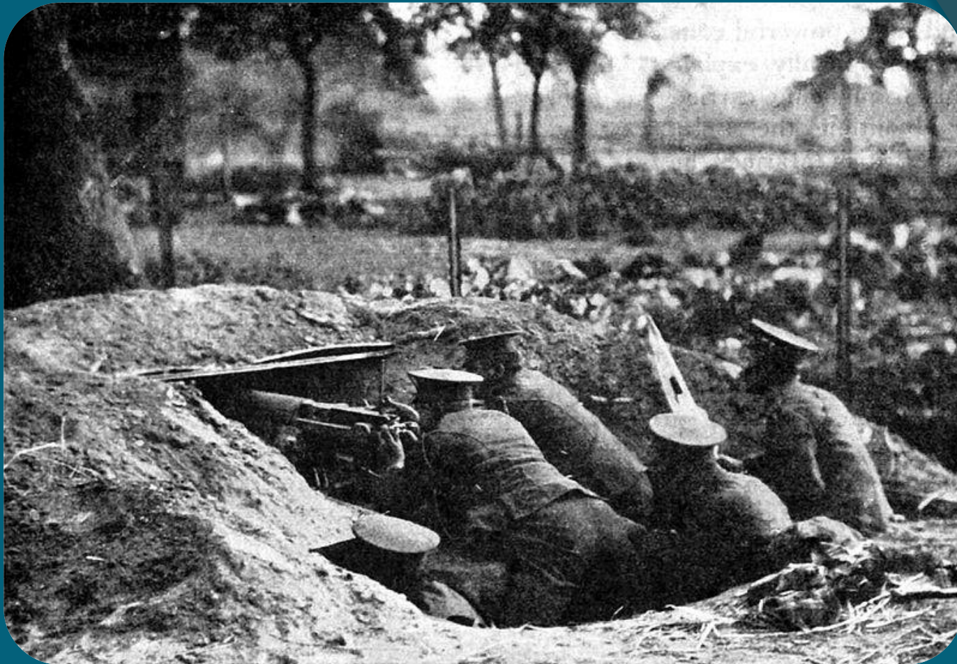
Русская маскировка позиции пулемёта «Максим».