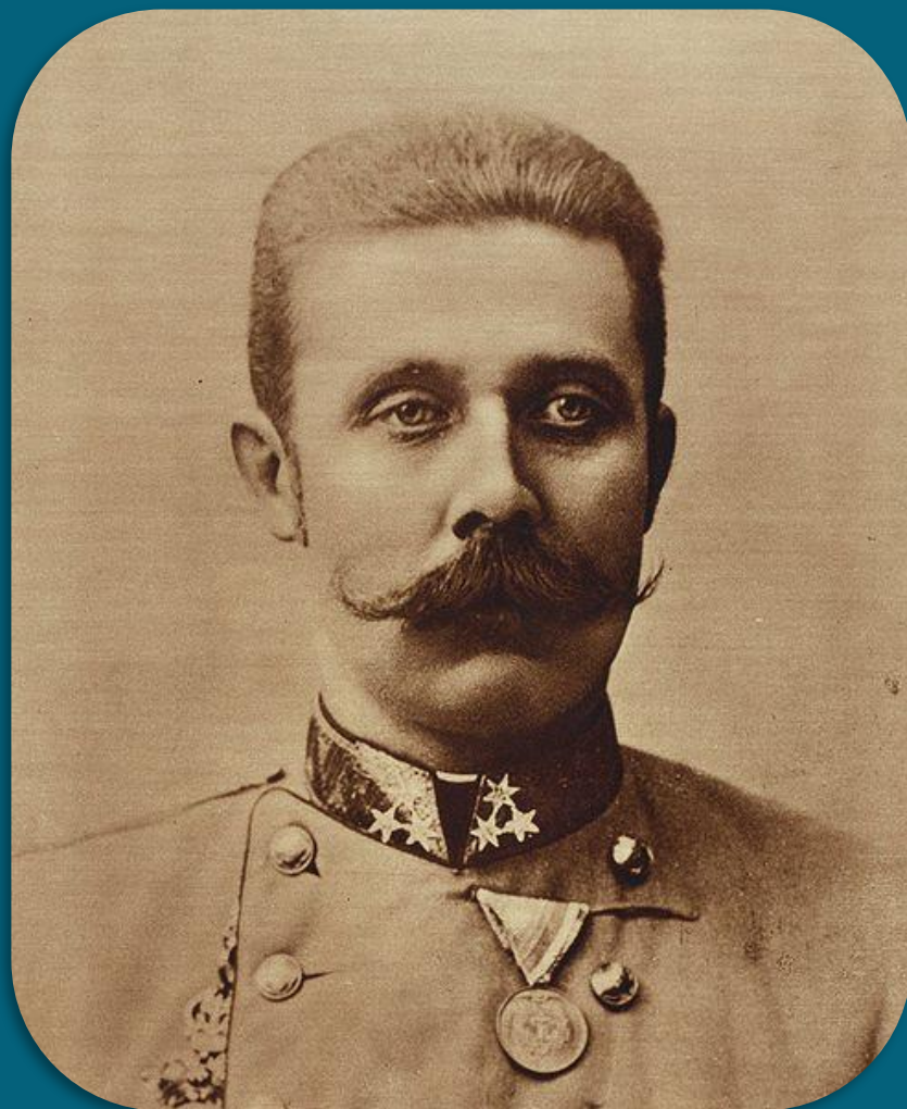
Эрцгерцог Франц Фердинанд