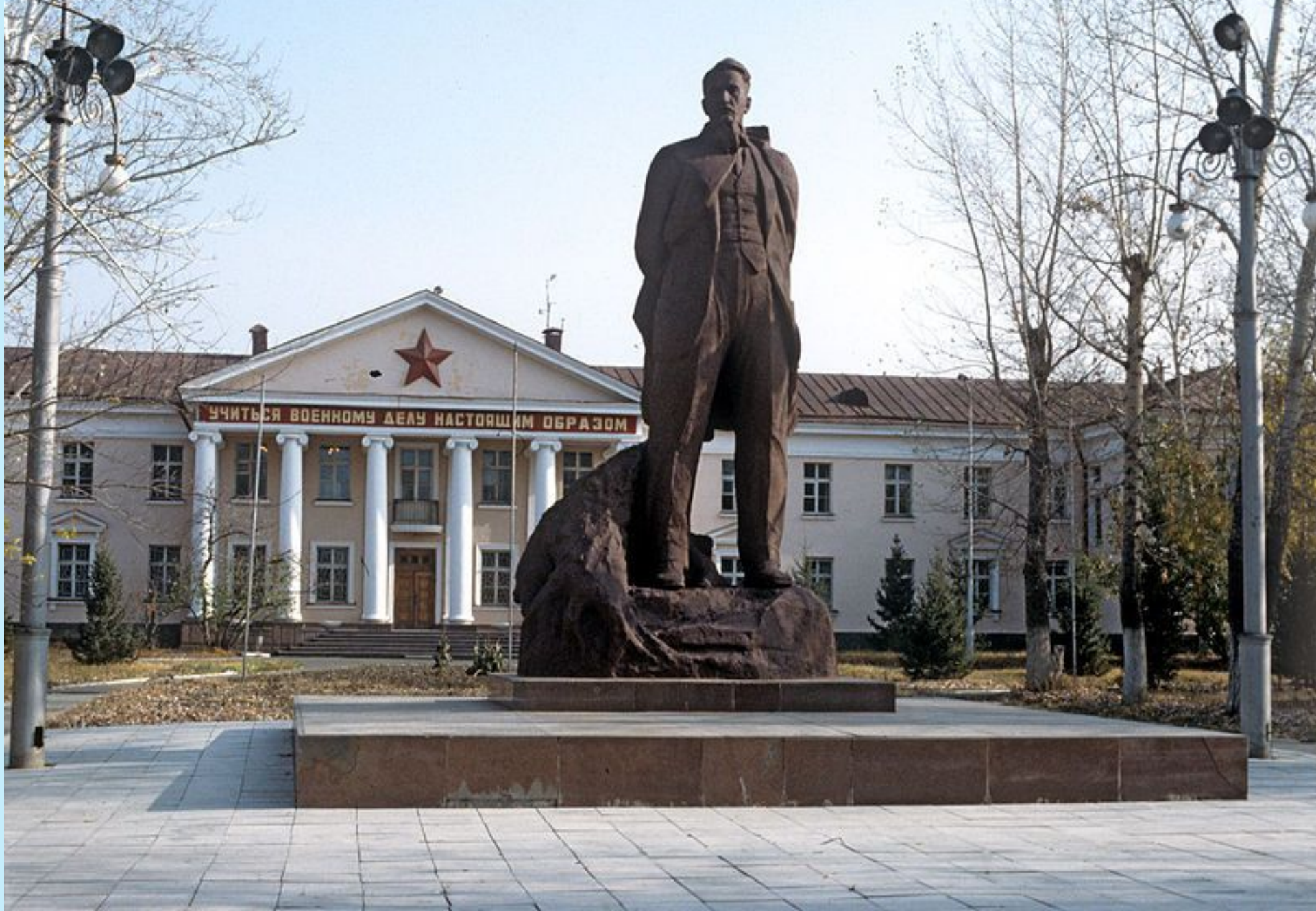
алдындағы И.В.Курчатовқа арналған ескерткіш