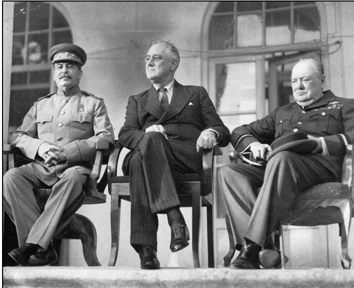
И.В. Сталин, Ф.Д. Рузвельт, У. Черчилль