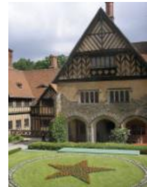
Дворец Цецилиенхоф — место проведения Потсдамской конференции