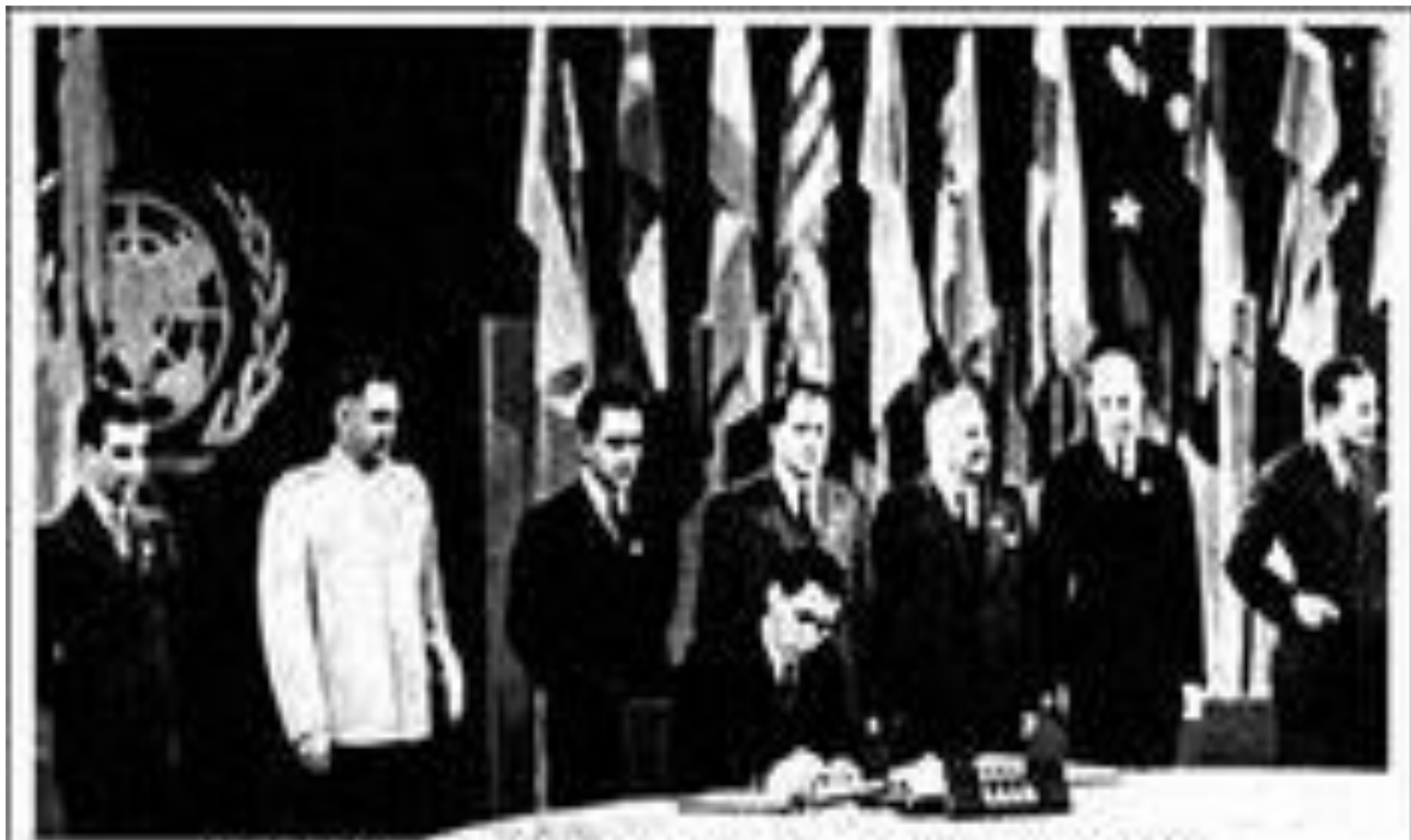
А. А. Громыко подписывает Устав ООН. Сан-Франциско. 26 июня 1945 года.