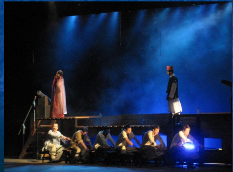
Перегляд мюзикла "Пригоди барона Мюнхаузена" в театрі ім.Гоголя