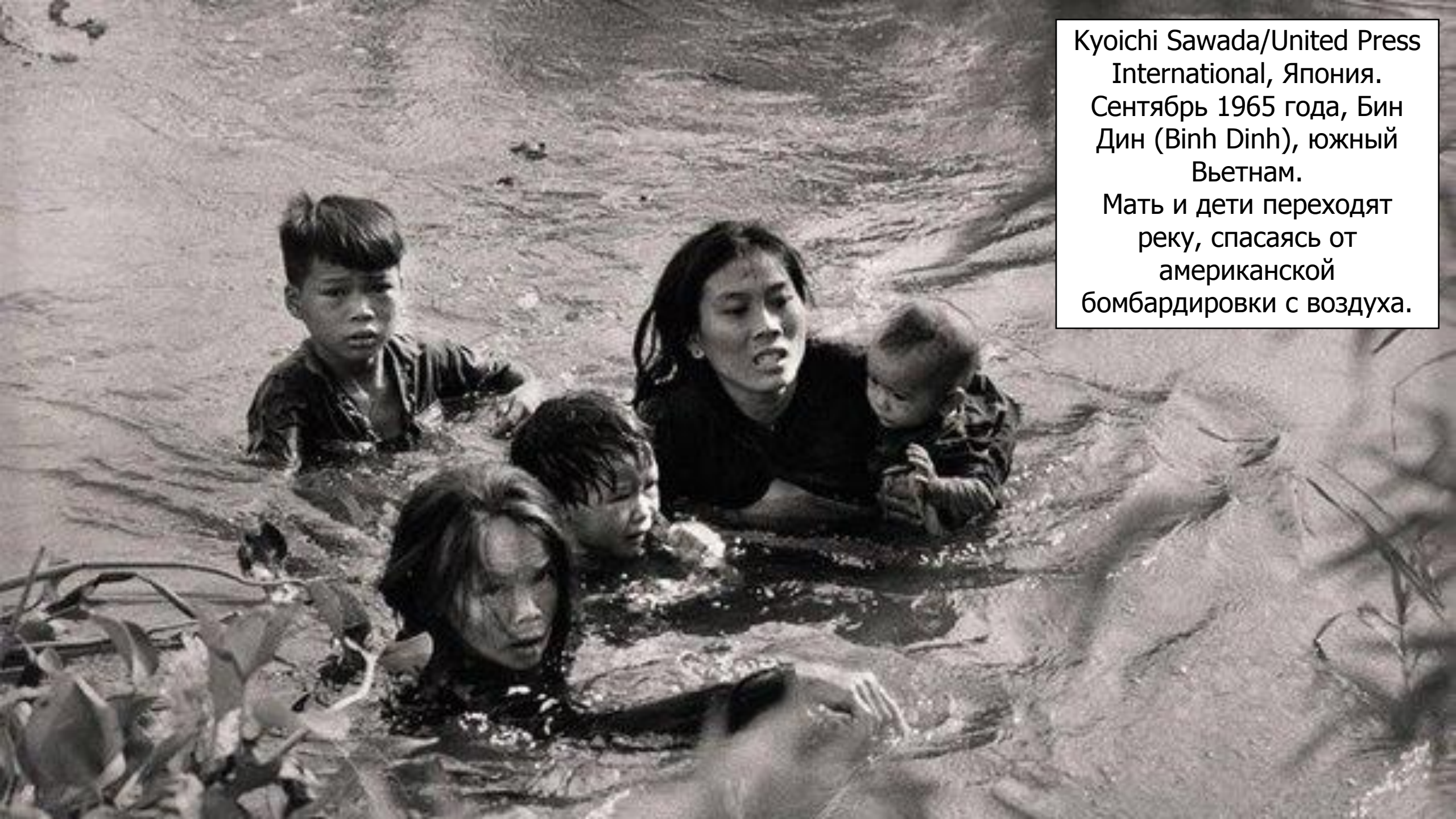
Кyoichi Sawada/United Press International, Япония. Сентябрь 1965 года, Бин Дин (Binh Dinh), южный Вьетнам. Мать и дети переходят реку, спасаясь от американской бомбардировки с воздуха.