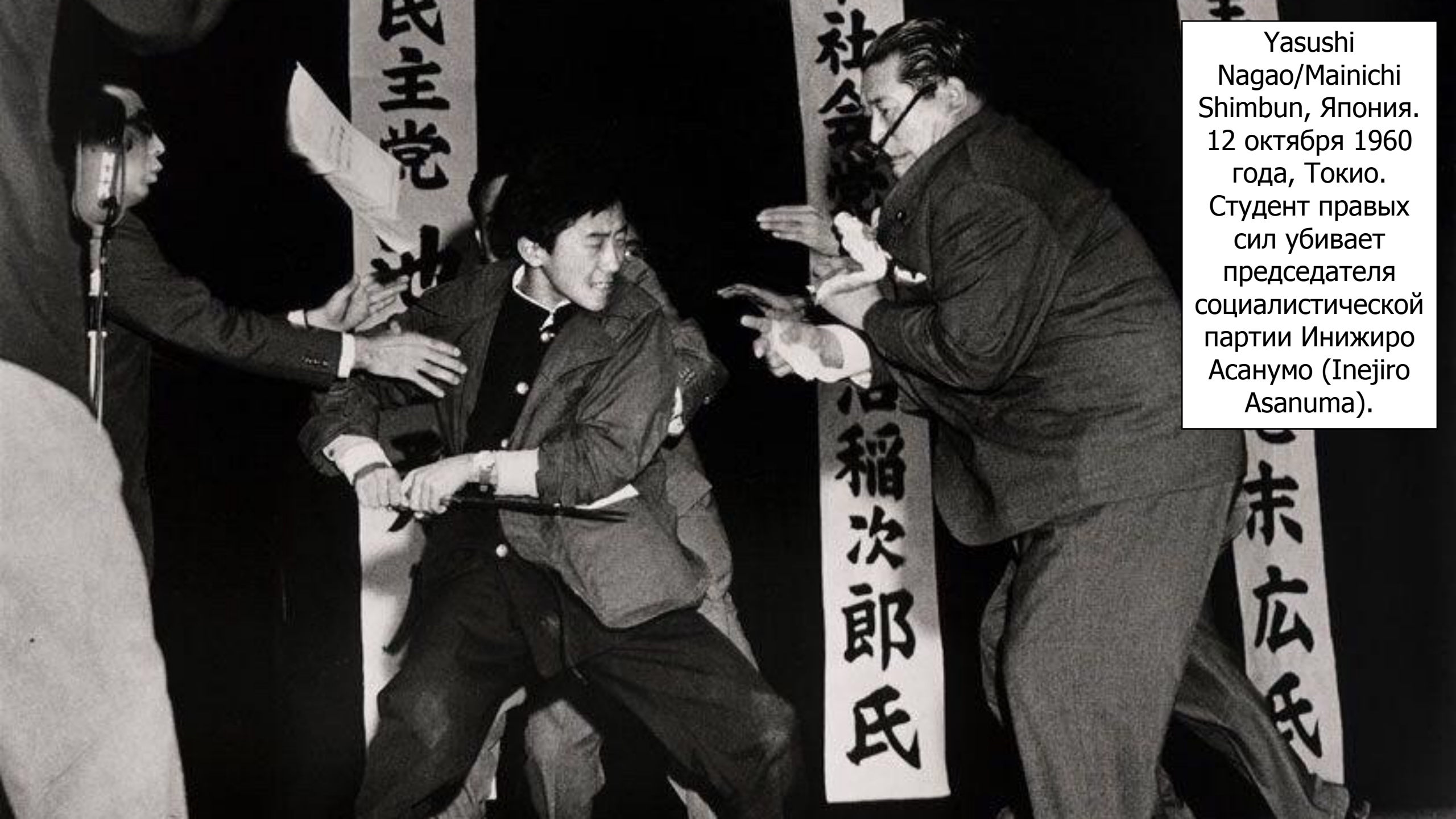
Япония. 12 октября 1960 года, Токио. Студент правых сил убивает председателя социалистической партии Инежиро Асанумо (Inejiro Asanuma).