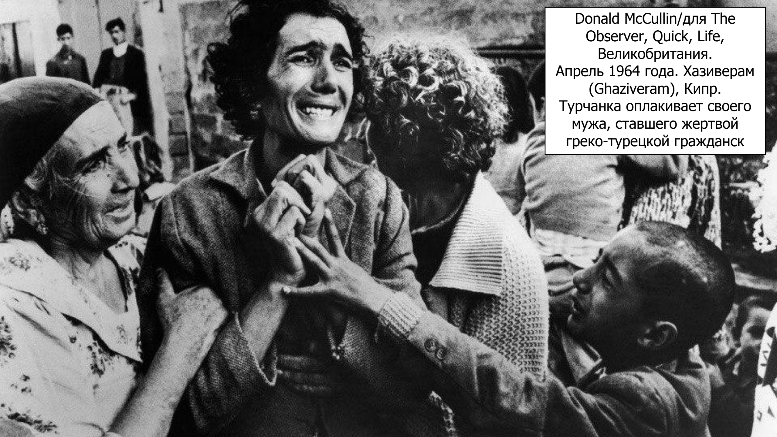
Donald McCullin/для The Observer, Quick, Life, Великобритания. Апрель 1964 года. Хазиверам (Ghaziveram), Кипр. Турчанка оплакивает своего мужа, ставшего жертвой греко-турецкой гражданск