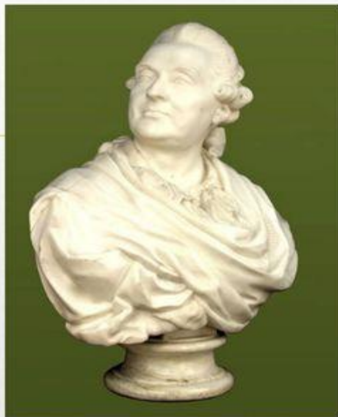
Ф.И. Шубин. Портрет князя А.М. Голицына. 1773. ГТГ.