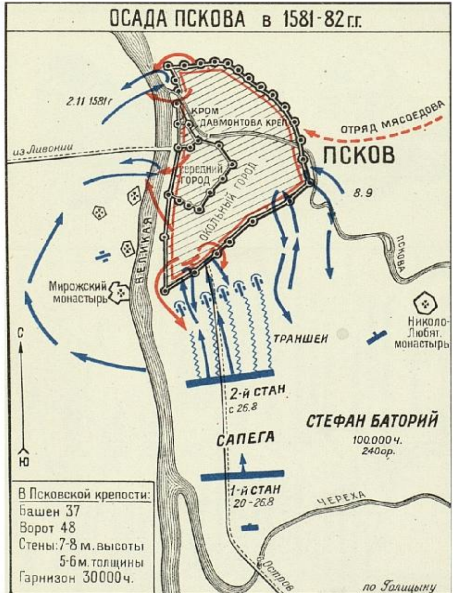
Осада Пскова. План-схема.