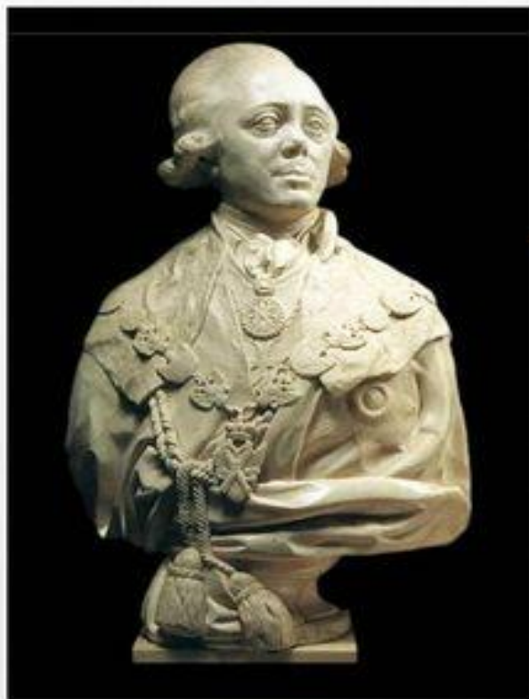
Ф.И. Шубин. Портрет Павла I. 1800. ГРМ