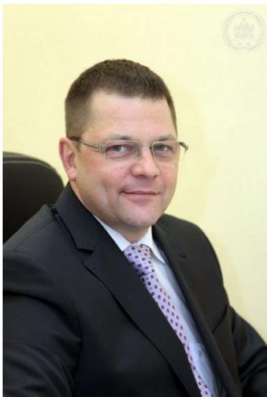
Проректор по учебной работе - профессор