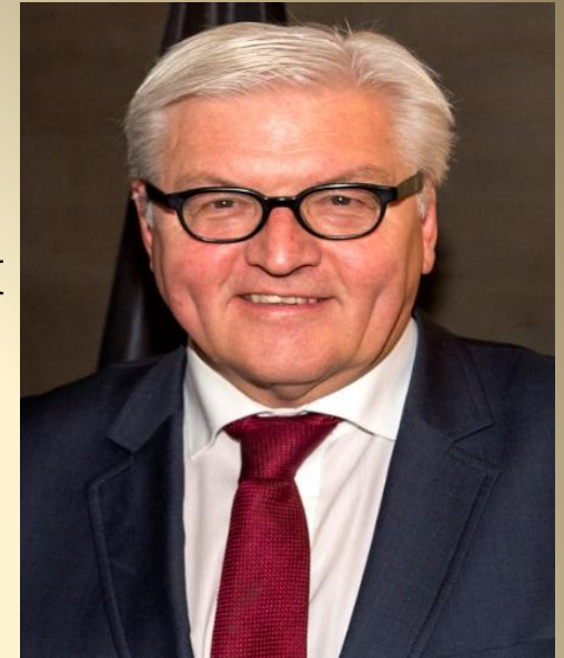
Глава государства – федеральный президент Франк-Вальтер Штайнмайер с 19 марта 2017. Выполняет представительские функции.

Германия – демократическое государство. По форме правления Германия – парламентская республика.