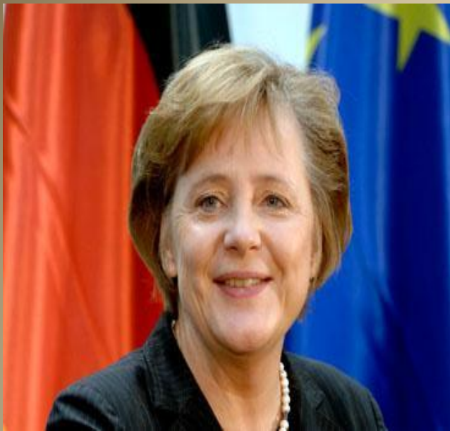
Ангела Меркель – федеральный канцлер Германии.

Германия – демократическое государство. По форме правления Германия – парламентская республика.