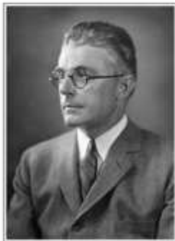
Д. Уотсон (1878-1958)

Задача психологии – установить однозначные отношения между стимулами и реакциями.