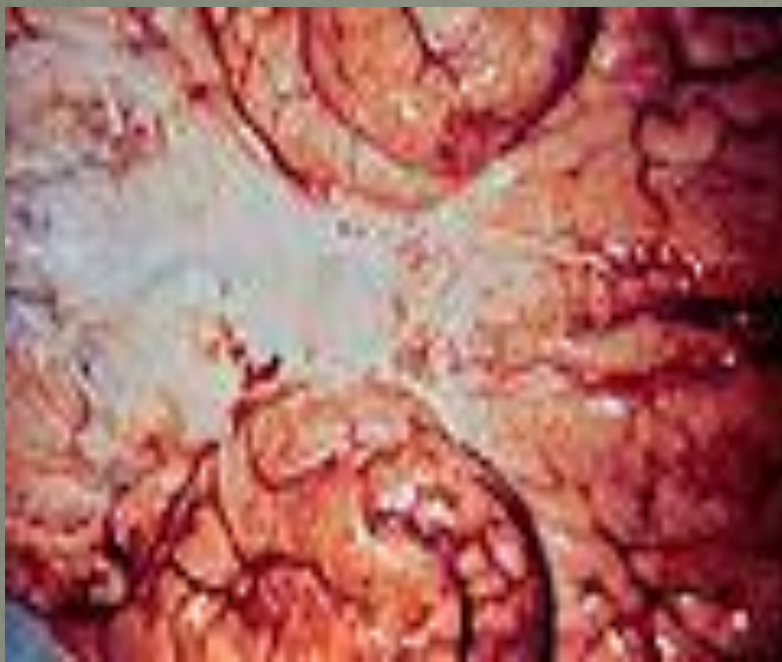
Гемофильді инфекциядан кейінгі органның ауыр дистрофиялық бүлінісі