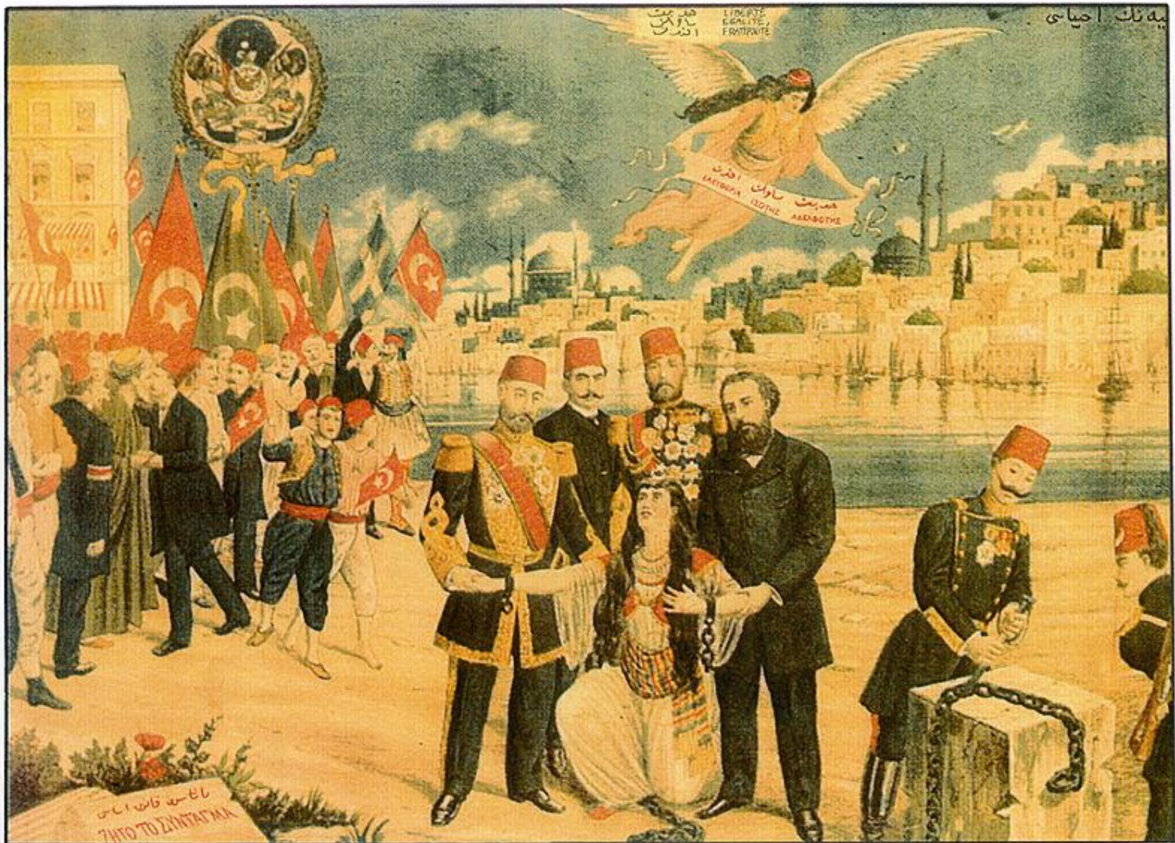
Didar-i Hürriyet kurtarılıyor (la Liberté sauvée) : carte postale de 1895, saluant la constitution ottomane du 23 novembre 1876, figurant le sultan Abdul-Hamid, les différents millets de l'empire (Turcs avec les drapeaux rouges, Arabes avec les drapeaux verts, Arméniens, Grecs) et la Turquie (non voilée), se relevant de ses chaînes. L'ange symbolisant l'émancipation porte une écharpe avec les mentions : « Liberté, Égalité, Fraternité » en turc et grec.