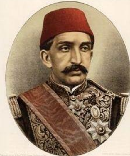
ABDUL HAMID II, SULTAN OF TURKEY