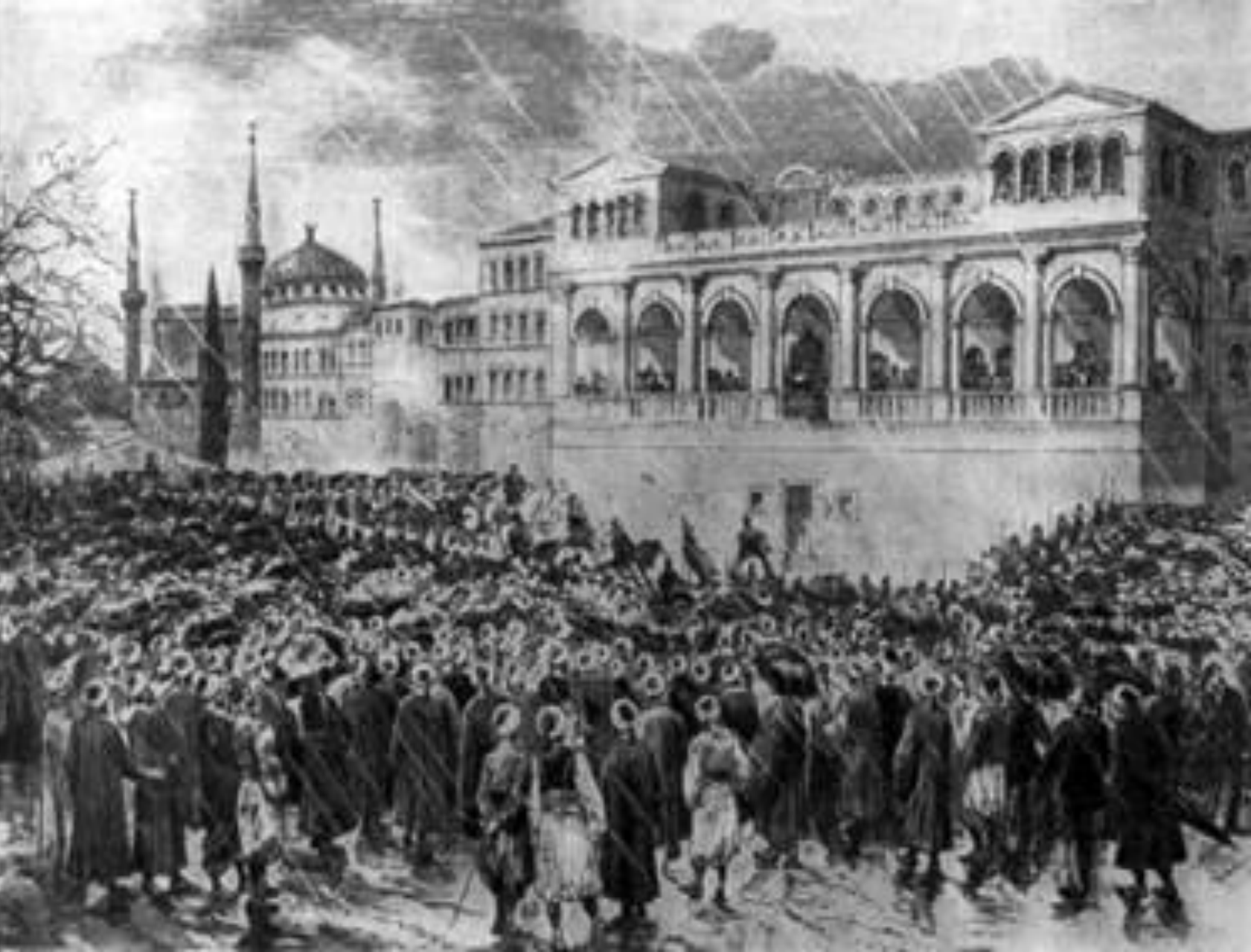
Провозглашение конституции в Стамбуле, 1876 год