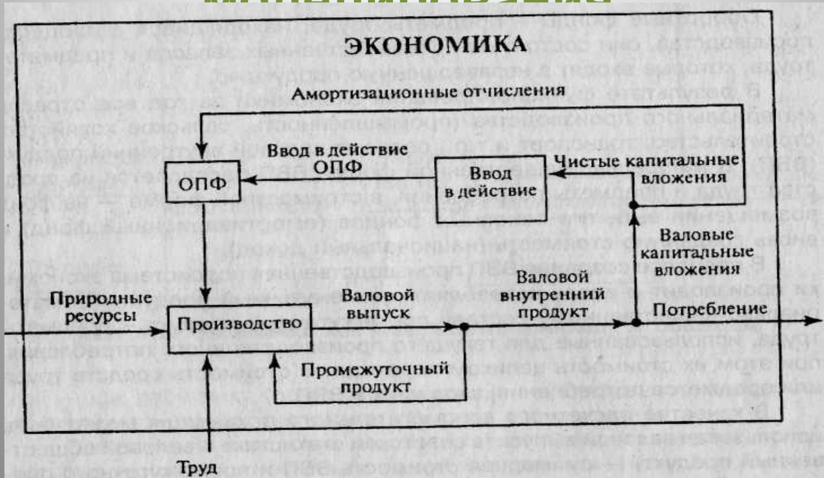
Рис. 1.3. Потоки продуктов и ресурсов в экономике