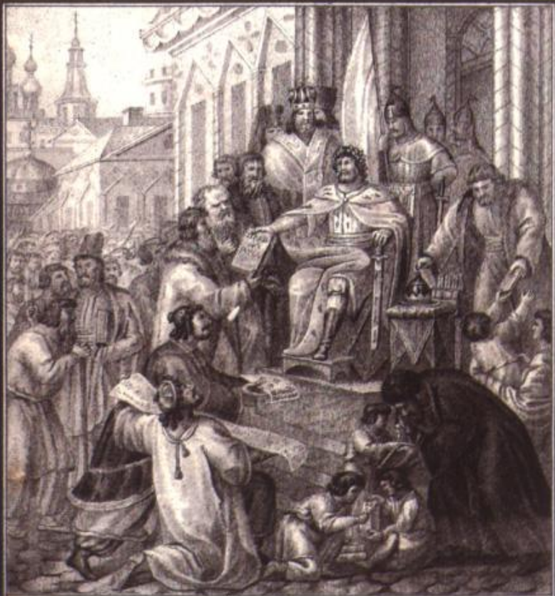
ЯРОСЛАВЪ ЗАКОНОДАТЕЛЬ 1019-1054

Ярославъ издастъ письменные законы, подъ названіемъ Русской правды.